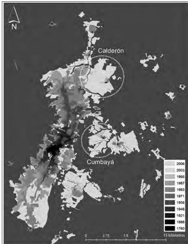
Mapa 1. Calderón y Cumbayá en el contexto del crecimiento expansivo de Quito, 1760-2006

Elaboración propia con datos del Instituto de la Ciudad del Municipio del Distrito Metropolitano de Quito (MDMQ).