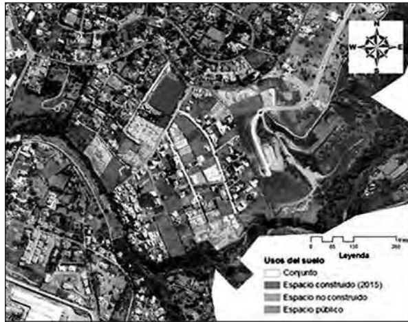
Mapa 4. Usos de suelo

Elaboración propia con base en fotografía satelital de Google Maps.