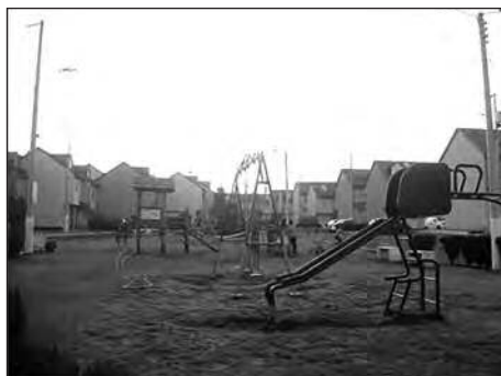
Imagen 1. Área de recreación en el conjunto Casales Buenaventura, construido entre 2001 y 2003

Los primeros conjuntos desarrollados a finales del siglo XX se caracterizaron por ser pequeñas construcciones realizadas por constructores particulares que compraron algunas de las antiguas quintas de la zona. Desde el año 2003 se iniciaron los grandes proyectos inmobiliarios instalados en antiguas zonas industriales o campos de cultivo. Los compradores correspondieron a las nuevas clases medias que obtuvieron créditos asequibles de parte del Estado a través del Instituto Ecuatoriano de Seguridad Social (IESS) y de bancos privados. Estos nuevos conjuntos se conformaron como verdaderas miniciudades que ofrecieron seguridad y acceso a la mayoría de servicios como pequeñas tiendas de abastos, servicio de guardería, centro médico, gimnasio o áreas de recreación.