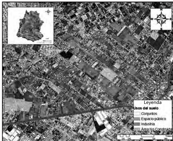
Mapa 2. Usos del suelo en Calderón

Elaboración propia con base en fotografía satelital de Google Maps.