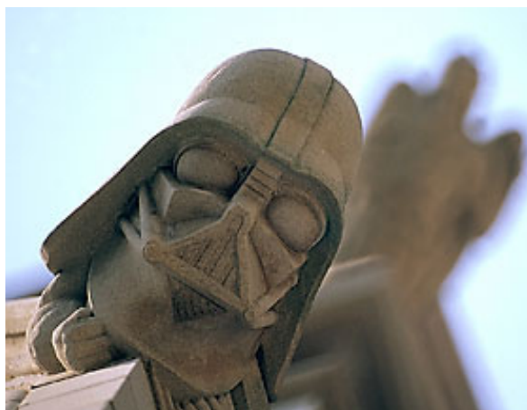
Figura 2. Protomo 8 de Darth Vader. (Fuente de la imagen: web de la Catedral de Washintong).

Hemos visto cómo la gárgola se abre paso en el mundo audiovisual mediante distintas interpretaciones, pero la relación de esta con los Mass Media no se queda en esta dirección, también podemos encontrar gárgolas realizadas en la actualidad con personajes salidos de estos medios. Al igual que vemos un astronauta en una de las portadas de la catedral de Salamanca, para atestiguar la época de la restauración y añadir un elemento actual a la iconografía del templo, encontramos gárgolas procedentes de Star Wars , Gremlins , Alien , Anime, o historias de miedo atemporales como la Parca, el hombre lobo, etc.