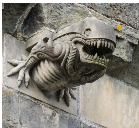
Figura 4. Gárgola Alien de la Abadía Paisley, Escocia.

Y como último ejemplo vemos el ala sur de la Abadía de Paisley, Escocia, que en 1991 fue reconstruida y con ello fueron añadidas nuevas gárgolas al templo. En esta representación encontramos referencias a los mencionados miedos atemporales, que se corresponden tanto con bestiarios actuales como con el imaginario tradicional. Vemos una colección de 12 gárgolas entre las que podemos ver la representación de la Parca , nuevamente un Alien , un lobo antropomorfizado , o un Greenman ; pero también un grifo , un hombre salvaje , o un hombre saliendo de un pez (posible representación de Jonás ).