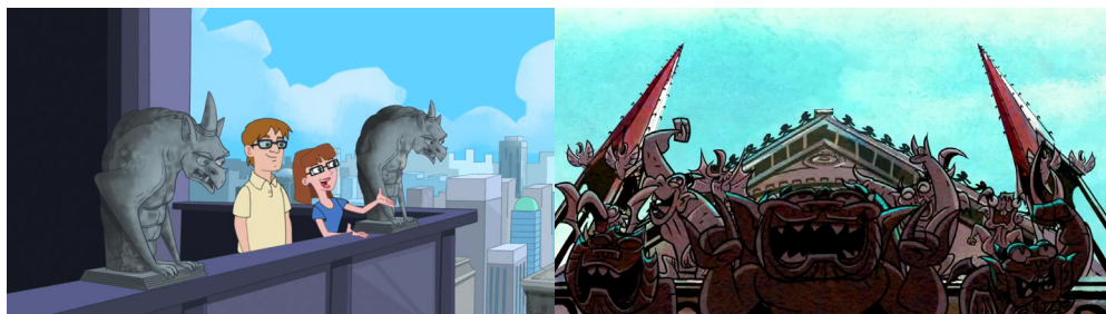
Figura 1A. En el episodio Corre, Candace, corre, los posibles compradores de la casa del doctor Heinz Doofenshmirtz se fijan en las quimeras del balcón comentando su gusto por tener una casa con gárgolas. Figura 1B. En el episodio El Croissant del Triunfo, las gárgolas vitorean a Mickey por pasar con su moto por encima del tejado de Notre Dame para evitar los atascos y llevarle a tiempo a Minnie unos croissants para su cafetería parisina.

El principal representante en esta categoría lo constituye la compañía Disney con sus distintas manifestaciones de gárgolas en animación, cine y cómics. Para no extendernos 7 hablaremos de las más representativas, por ser las más conocidas, nos referimos a las gárgolas del Jorobado de Notre Dame y, en especial, a las gárgolas de la serie Gargoyles , que tuvo repercusión en películas, videojuegos, cómics y convenciones. Estas gárgolas, en su mayoría, corresponden a estos seres protectores que cobran vida y que interactúan con los humanos sin dañarlos. Disney también usa con frecuencia la gárgola ornamental (así como la quimera) en sus grandes construcciones y como guiño cómico muchas veces (por ejemplo en el capítulo de Phineas y Ferb : Corre, Candace, corre; o en Disney Mickey Mouse , en el episodio El Croissant del Triunfo).