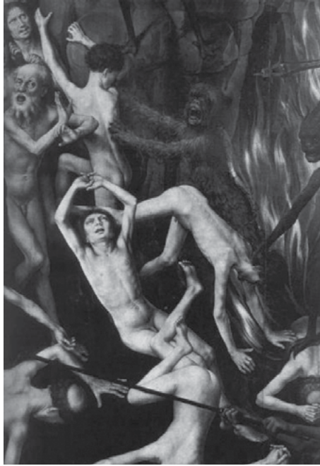
Figura 9. Hans Memling. Detalle del tríptico del Juicio final , 1467-1471, Museo Narodowe

Eusebio de Cesarea, hablando de los mártires cristianos de Tebaida, relata la tortura en la que la desnudez representaba uno de los principales espectáculos: “ataban a las mujeres por un pie y las suspendían en el aire mediante unas máquinas, con la cabeza para abajo y el cuerpo enteramente desnudo y al descubierto, ofreciendo a todos los mirones el espectáculo más vergonzoso, el más cruel e inhumano de todos” 49 .