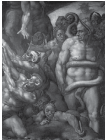
Figura 12. Miguelángel. Detalle del cardenal Biagio de Cesena como Minos, Juicio Final de la Sixtina, Roma

La responsabilidad inherente al arte cristiano, al arte sacro, le compete con mayor gravedad y delicadeza ponerlo todo en comunión con lo divino. Ciertamente lo erótico tiene ingredientes de experiencia religiosa, para citar de nuevo a G. Bataille, pero esos son otros recursos, inútiles a este tipo de estética.