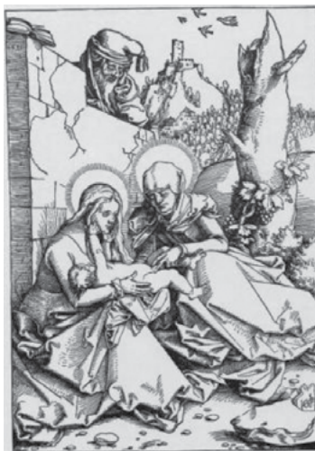
Figura 13. Hans Baldung Grien. La Sagrada Familia , 1511

En concordancia con L. Steinberg, también Daniel Arasse afirma que el tema de la adoración de los magos se convierte, para esta época, en un argumento sensible y recurrente como se evidencia en el juego de gestualidades: mientras uno de los magos se postra para adorar al Niño observando curiosamente entre sus piernitas; María las separa, se las cubre con un paño, o a veces, sostiene la mano del Niño para facilitar esta visión (Arasse, 2005, pp. 42-43).