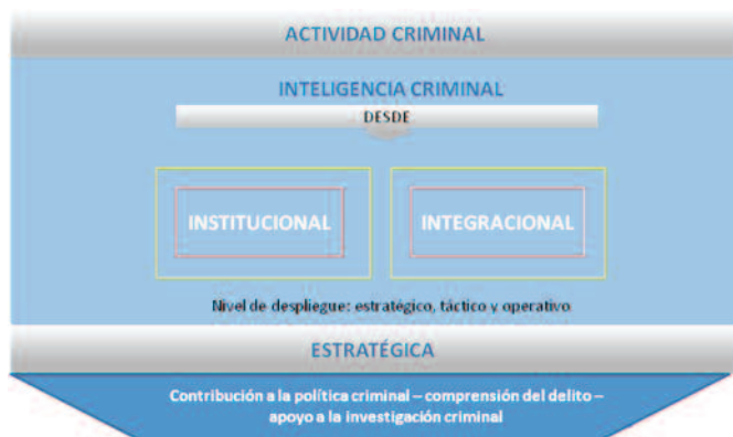
Gráfico 3. Modelo de inteligencia criminal propuesto

Desde hace medio siglo la DIJIN consolida la estadística contravencional y criminal, siendo éste el primer paso del análisis criminológico para conocer sus variaciones y fluctuaciones; por tanto, es necesario fortalecerlo, en especial, si se tiene en cuenta que la actividad criminal, como fenómeno social, se encuentra en transformación constante, hecho que obliga a utilizar herramientas a la par con los factores generadores y facilitadores del delito, lo cual a su vez, permite abordarlo desde perspectivas diferentes y estimular la corresponsabilidad autoridades-comunidad en la búsqueda de verdaderas soluciones.