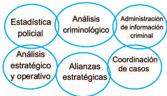
Gráfico 4. Procesos propuestos

- Estadística policial. Orientado a recolectar y procesar las estadísticas delincuenciales y contravencionales de manera técnica.