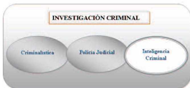
Cuadro 6. Componentes propuestos

La inteligencia criminal en la Institución atiende a las siguientes consideraciones: