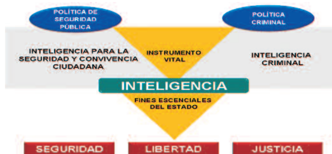
Gráfico 2. Concepción de inteligencia criminal

La inteligencia criminal se despliega dentro de los organismos de investigación criminal que aprovechan la información acumulada por ellos; en este sentido, la DIJIN junto con los grupos que cumplen actividades de investigación criminal adscritos a las Direcciones: Policía Fiscal y Aduanera, Tránsito y Transporte, Antisecuestro y Antiextorsión, Carabineros y Antinarcoóticos son las avocadas a fortalecer lo que Gran Bretaña ha llamado “la nueva inteligencia para entender el crimen organizado” (Tim J. y Maguire M., 2004).