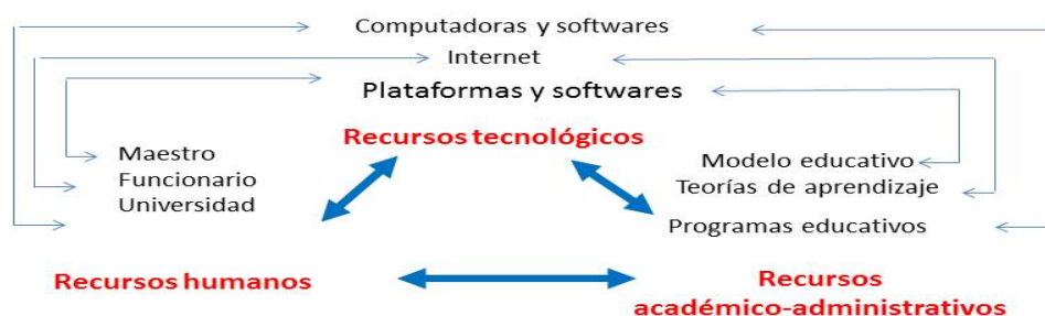
Figura 1 Sistema complejo de la educación a distancia

A raíz de lo anterior, mi unidad de observación en específico es la modalidad semiescolarizada de la Benemérita Universidad Autónoma de Puebla (BUAP) 6 , en tanto que la defino como un sistema complejo en atención a que en la misma, interactúan diversos elementos heterogéneos o subsistemas tales como por ejemplo, sus recursos humanos (profesores, estudiantes, diseñadores instruccionales, computólogos, etc.), sus recursos tecnológicos (computadoras, plataformas instruccionales, softwares y programas informáticos, etc.) y sus recursos académico-administrativos (modelos pedagógicos, teorías de aprendizaje, planes de estudios, estrategias y metodologías didácticas a distancia, etc.). Los cuales a su vez se auto-organizan de muy diversas maneras y están en permanente y continua interacción en su interior; afectando con ello a otros subsistemas del gran sistema o bien o a la totalidad de éste. (Ver figura 1)