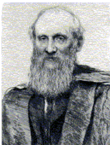
William Thomson, Primer barón de Kelvin (Belfast, Irlanda, 26 de junio de 1824, † Netherhall en Largs, Escocia, 17 de diciembre, 1907)