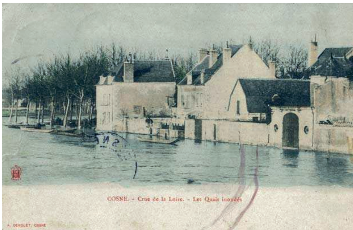
Muelles inundados de la orilla del Loira, en Cosne

Para luchar contra estas catástrofes, la primera medida fue la construcción, a lo largo de los años, de diques de tierra. Los primeros de que tenemos constancia datan de la época de Luis el Piadoso, nieto de Carlomagno. Por esta razón, hoy existen dos muros continuos de cientos de kilómetros de longitud, (les levées) que protegen los campos y las zonas urbanas o industriales a lo largo del río. Algunos tienen dispositivos (déversoirs) para desviar las aguas de la inundación a inmensas zonas sin construcciones, especialmente reservadas para ello. Así se merma la potencia de la riada principal. Además, se ha construido la presa de Villerest, río arriba de Roanne, única solución para oponerse a las riadas en la parte superior del río.