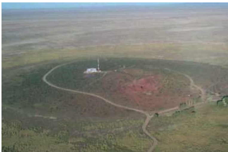
Vista aérea del edificio central del observatorio