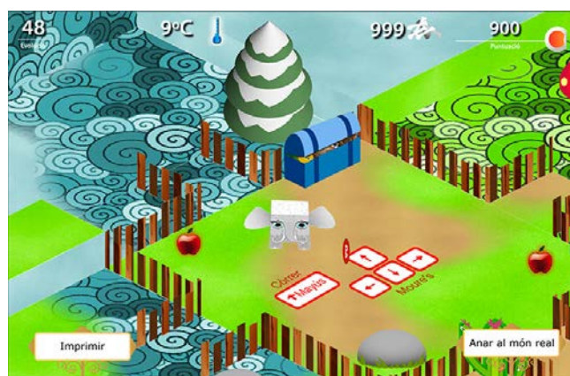
Figura 2. Nivel 4, "Mundo imaginario".

de la historia del siglo XX. En este nivel se recuerda, de manera muy simple, el cálculo de fracciones y se hace referencia al modernismo. Durante el nivel 2, Sandra conocerá a Miquel, de quien aprenderá el método científico: observación, hipótesis, experimentación, conclusión y elaboración de una teoría. Por eso, después de observar cómo recoge muestras sobre el terreno ella podrá reunir las propias para ir al laboratorio. En este espacio Sandra podrá experimentar con los huesos y fósiles reunidos para formar esqueletos de varios animales; esto le permitirá adentrarse en el “mundo imaginario”, el siguiente nivel donde simulará la vida de estos animales. El uso de un imaginario que contenga información relevante del juego se utiliza para atraer a los alumnos a través de lo irreal, y constituye un espacio paralelo al