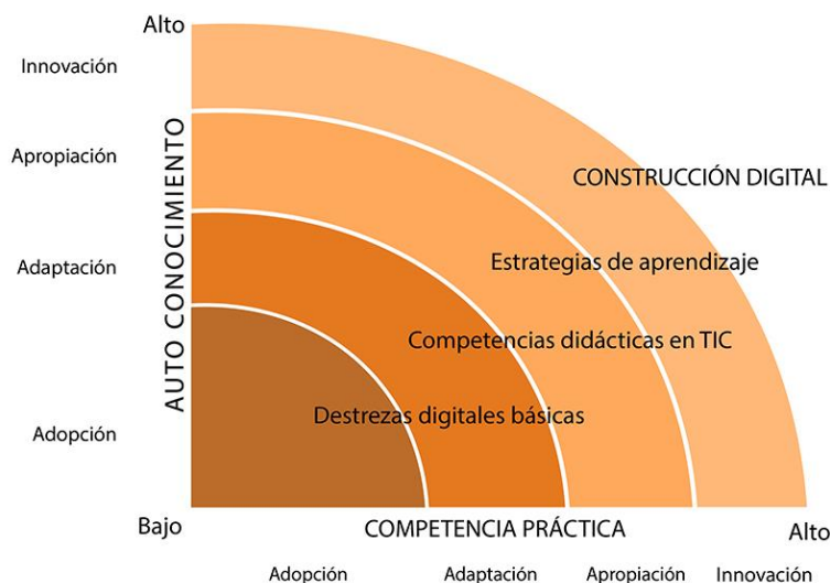
Figura 2. Modelo de adopción de las TIC (Krumsvik, 2009, 178)

Otra de las propuestas es la realizada por Krumsvik (2009), que establece que la competencia digital del profesorado está formada por cuatro componentes básicos que se alcanzan de manera sucesiva: las habilidades digitales básicas, la competencia didáctica con las TIC, las estrategias de aprendizaje y la formación o capacitación digital (figura 2).