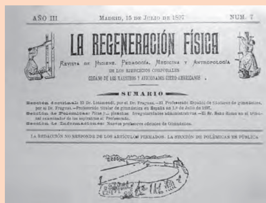
Cabecera de la primera página de La Regeneración Física , 1897