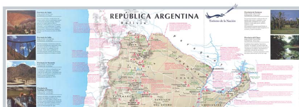
Figura 1. Argentina. Mapa turístico. Secretaría de Turismo de la Nación (1997-1998), (fragmento).

En la mayoría de los casos, los mapas combinan lugares turísticos emblemáticos con otros que no lo son y recurren a una arquitectura visual que diluye esas jerarquías: los estereotipos turísticos aparecen intercalados con otros lugares turísticos “inventados”. 20 Esta estrategia serviría, entonces, tanto para instalar y promocionar nuevos lugares y atractivos turísticos como para “equilibrar” gráficamente la