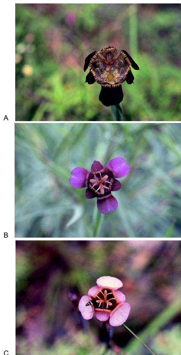
Fig. 2. A. Tigridia potosina López-Ferrari & Espejo (ejemplar testigo: A. Espejo et al. 5134 (UAMIZ)); B. Tigridia multiflora (Herb.) Ravenna (ejemplar testigo: A. R. López-Ferrari et al. 2289 (UAMIZ); C. Tigridia multiflora (Herb.) Ravenna (ejemplar testigo: A. R. López-Ferrari et al. 2031 (UAMIZ).