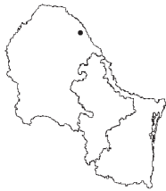
Aristida oligantha Michx.