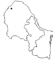
Aristida ternipes Cav. var. gentilis (Henrard) Allred