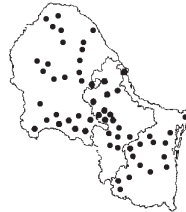
Aristida purpurea Nutt. var. purpurea