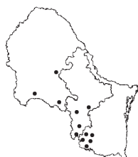
Aristida curvifolia E. Fourn.