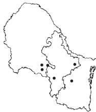
Aristida divaricata Humb. & Bonpl. ex Willd.