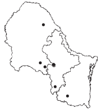
Aristida purpurea Nutt. var. fendleriana (Steud.) Vasey