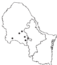
Aristida arizonica Vasey