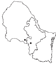
Aristida havardii Vasey