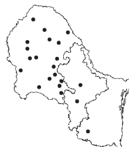
Aristida purpurea Nutt. var. wrightii (Nash) Allred