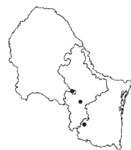
Aristida schiedeana Trinius & Ruprecht var. schiedeana