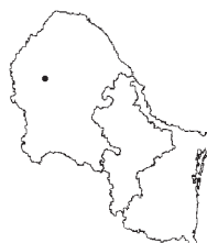
Aristida gypsophila Beetle f. gypsophila