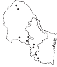
Aristida pansa Woot. & Standl. f. contracta Allred & Valdés