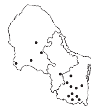
Aristida ternipes Cav. var. ternipes