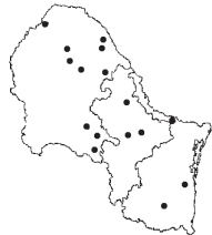
Aristida purpurea Nutt. var. longiseta (Steud.) Vasey