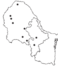
Aristida purpurea Nutt. var. perplexa Allred & Valdés