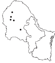
Aristida gypsophila Beetle f. gypsophiloides Allred & Valdés