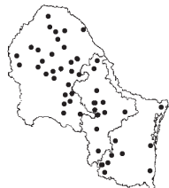
Aristida purpurea Nutt. var. nealleyi (Vasey) Allred