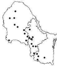
Aristida pansa Woot & Standl. f. pansa