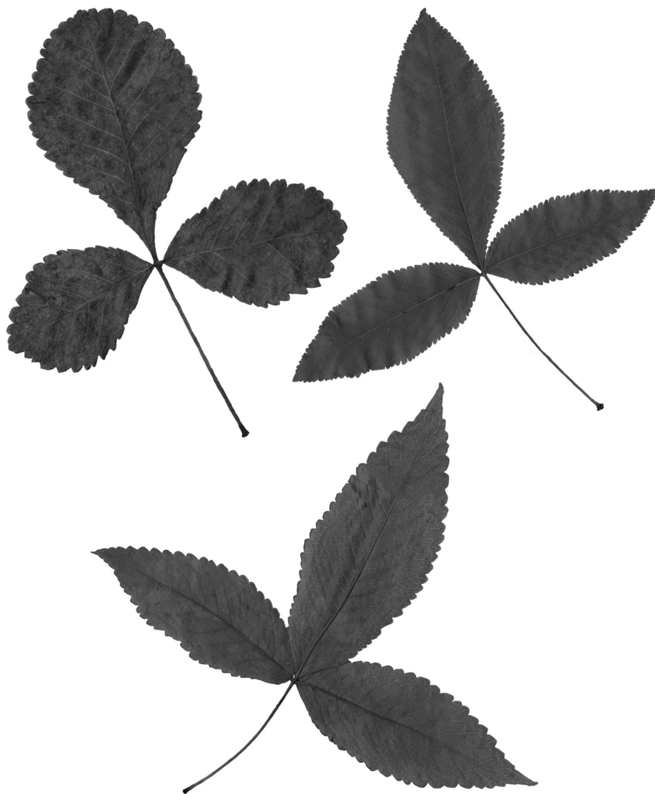
Fig. 2. Hojas de Bursera heteresthes encontradas en algunas de sus poblaciones, ilustrando la variabilidad en la forma general, en el ápice y en el margen de los foliolos.