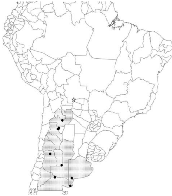
Figura 2. Mapa de distribución de Eudinopus dytiscoides . El color resaltado muestra las provincias

Este registro se constituye en el primero para Bolivia considerando la lista de escarabajos peloteros elaborada por Hamel et al. (2006); así mismo incrementa su distribución E. dytiscoides en 494 km en línea recta hacia el norte desde Jujuy, Argentina (Fig. 2), área ubicada dentro de la zona del Gran Chaco. En la zona estudiada, es de actividad completamente diurna y aparentemente tiene mayor preferencia al excremento fresco (reciente).