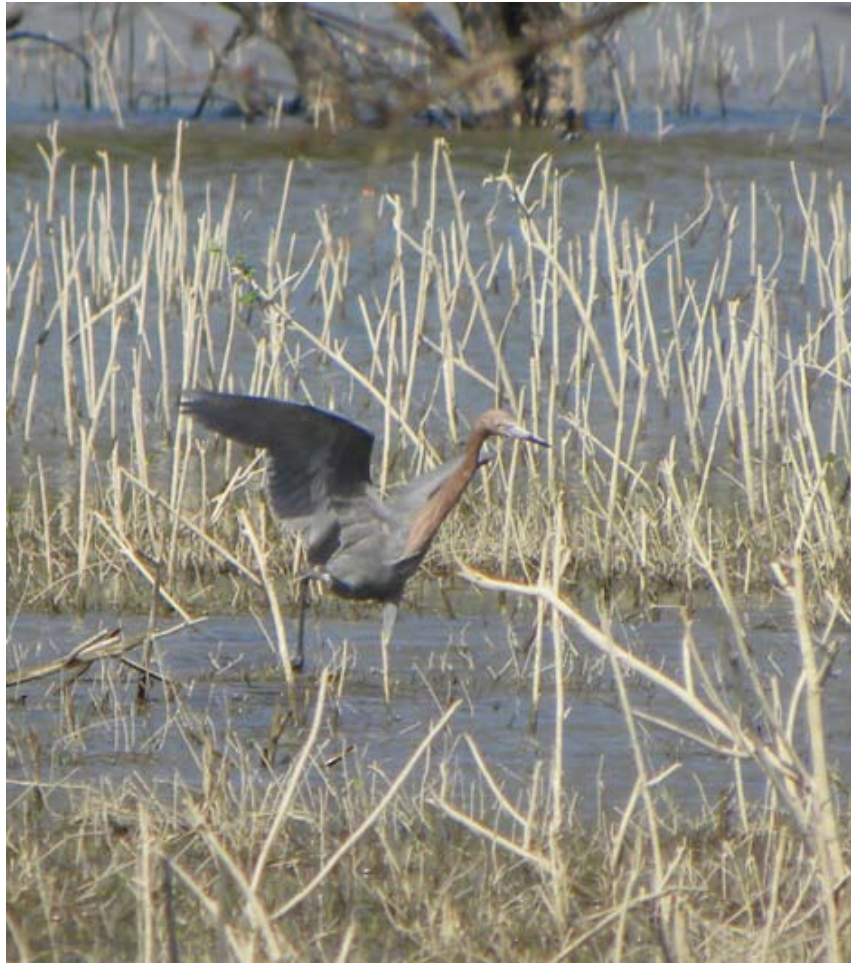
Figura 2. Egretta rufescens . Laguna de Metztlán, Hidalgo.

15 m. Adicionalmente, el 17 de noviembre de 2008, colectamos un adulto (H-AV-347) en el río San Pedro, a 250 m al noreste de la localidad de San Felipe Orizatlán (21°10'35" N, 98°36'06" O; 164 msnm). Este individuo se encontraba perchando junto a seis individuos de Egretta thula en un árbol de sabino.