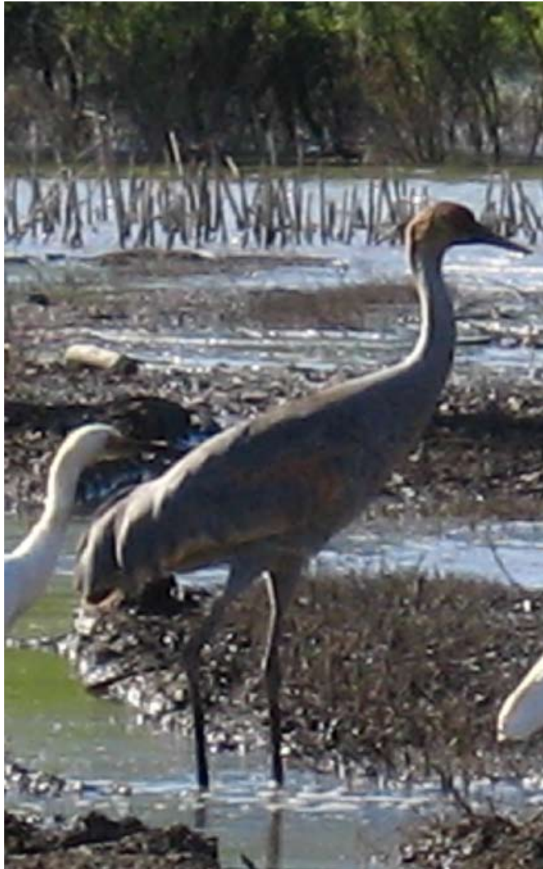
Figura 4. Grus canadensis juvenil. Laguna de Metztitlán, Hidalgo.