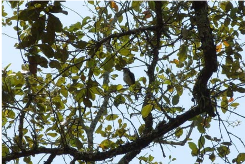
Figura 6. Legatus leucophaius . Huexotitla, San Felipe Orizatlán, Hidalgo.

Las características morfológicas del espécimen concuerdan con las de la subespecie C. f. salicicola (Pyle 1997; Garrido & Rodríguez 1999; Sibley 2000; National Geographic Society 2002; Andersen et al. 2007).