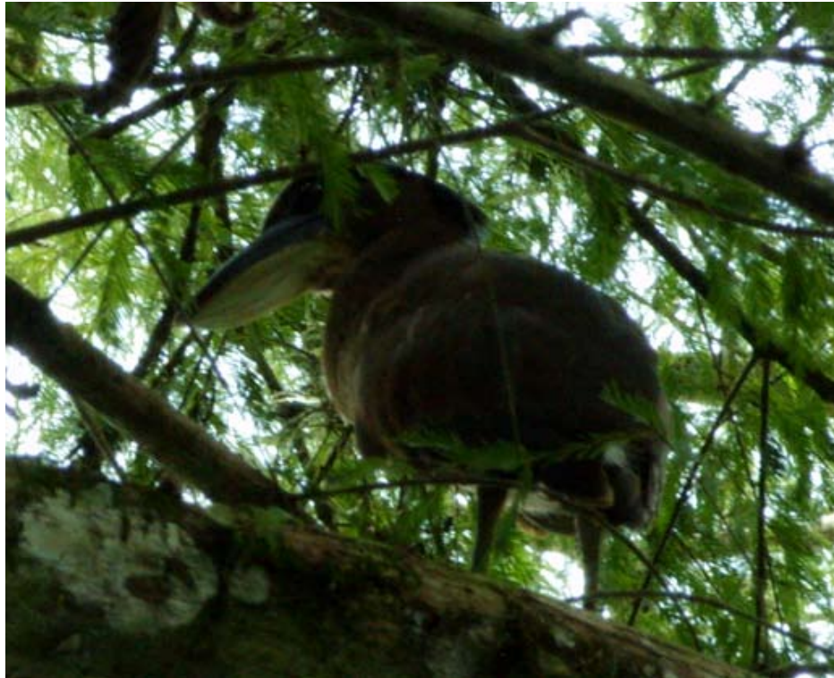
Figura 3. Cochlearius cochlearius juvenil. Santo Domingo, San Felipe Orizatlán, Hidalgo.

de agua de la Laguna de Metztlán. De febrero a mayo de 2008, continuamos observando un juvenil, probablemente el mismo individuo.