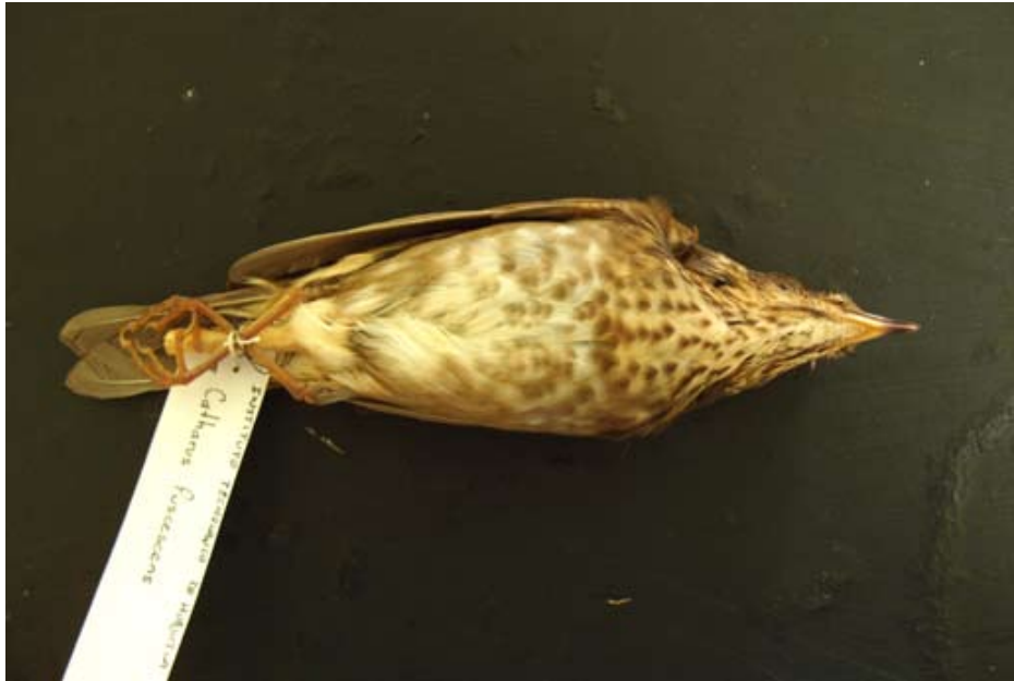
Figura 7. Catharus fuscescens . Tamala, Tepehuacán de Guerrero, Hidalgo.

Geothlypis philadelphia . El 7 de marzo de 2010, a 2 km al sureste de la comunidad de Yahualica, municipio de Yahualica (20°56'57" N, 98°22'55" O; 660 msnm), observamos, a 5 m de altura, una hembra y un macho forrajeando en un árbol de chaca ( Bursera simaruba ) junto con una parvada mixta de parúlidos.