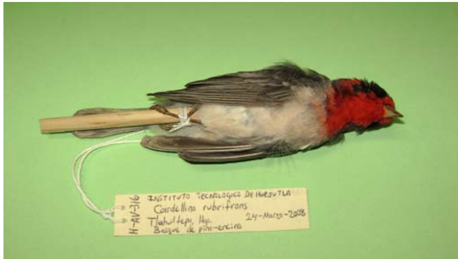
Figura 8. Cardellina rubrifrons . Tlahuiletepa, Tlahuiletepa, Hidalgo.

esto está ligado a los sitios en donde se enfocaron nuestros esfuerzos de muestreo, pero aun así, enfatiza la necesidad de intensificar los estudios en estas zonas de Hidalgo parcialmente conocidas. Catorce de estos nuevos registros corresponden a especies migratorias; sin embargo, en general incluyen pocos individuos. En el caso de las especies Egretta rufescens , Grus canadensis , Limosa haemastica , Legatus leucophaeus , Vireo flavifrons , Catharus fuscescens , Vermivora cyanoptera , Setophaga castanea , Geothlypis philadelphia y Cardellina rubrifrons las registramos en los límites de su distribución durante sus movimientos migratorios o incluso fuera de ellos (Howell & Webb 2005; Sibley 2000). Las familias con más registros nuevos para la avifauna del estado fueron Scolopacidae (4 especies) y Parulidae (4 especies).