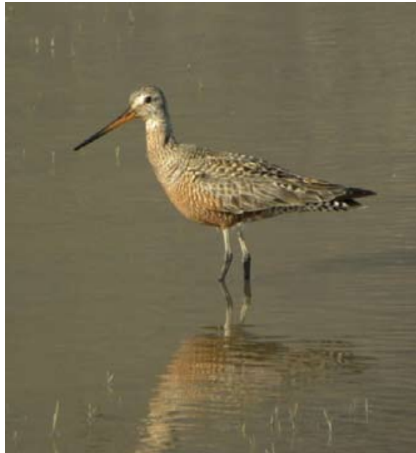
Figura 5. Limosa haemastica . Laguna de Metztitlán, Hidalgo.

Sterna forsteri . El 29 de abril de 2010, observamos, durante 45 minutos, un individuo sobrevolando y lanzándose en picada en aguas someras de la Laguna de Metztitlán (20°41'03" N, 98°50'34" O; 1253 msnm). Al aproximarse al sitio de observación, fue posible distinguir su pico delgado de color naranja y punta negra, las puntas de las alas plateadas, además de que su cola era notoriamente larga y bifurcada.