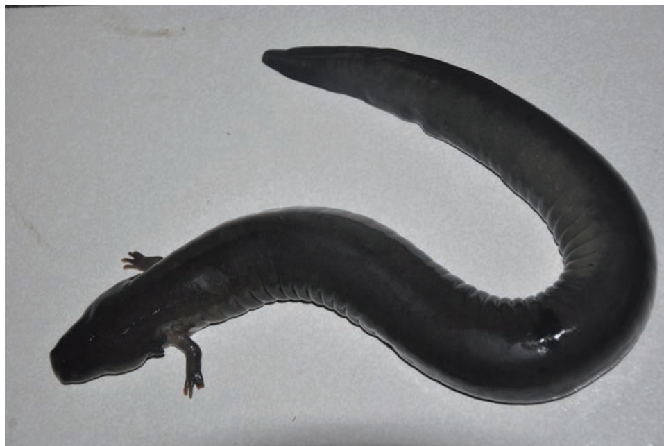
Figura 2. Ejemplar de Siren intermedia del municipio de Tuxpan, Veracruz, México.

los individuos, así como las variaciones en otras características morfológicas, sugiere la necesidad de realizar estudios taxonómicos y moleculares, ya que es una especie poco estudiada.