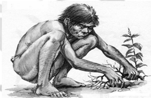
Figura 1: Aproximación de riesgos ocupacionales

osteomas del canal auditivo que consistía en el crecimiento óseo que ocluye el conducto auditivo y esto podía producir sordera mecánica a causa de las inmersiones al bucear los hombres, en la mujer se observa una lesión en las articulaciones del tobillo, patología producida por estar mucho tiempo en cuclillas escamando mariscos; en los agricultores, artrosis en columna cervical, cadera, rodilla y en la muñeca debido a la postura, como también osteoporosis producida por llevar cargas ajustadas a la frente mediante un capacho (cuerda) en distintas actividades que requerían de esfuerzo. (Ver figura 1)