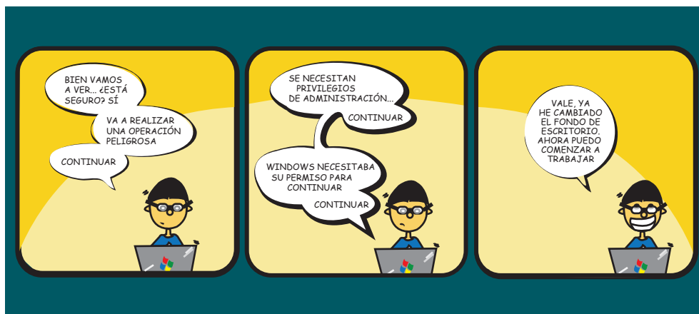
Figura 4. ¿Operación peligrosa en Windows?