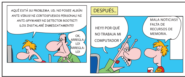
Figura 5. Acerca de programas de seguridad en su PC (texto traducido del diseño original al español).