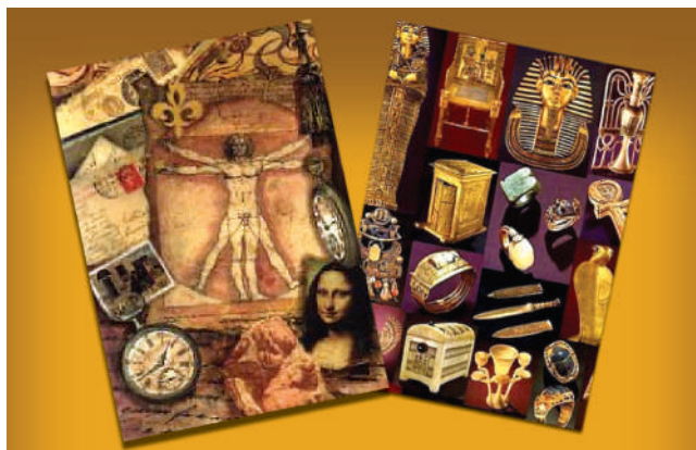
Figura 1. Objetos representativos de civilizaciones existentes [2] y [3].

En la actualidad, la información sigue siendo el objeto de mayor valor para la colectividad y para las organizaciones especialmente por su relevancia en la toma de decisiones. La llamada Sociedad de la Información, que según la enciclopedia Wikipedia define como: "Aquella en la cual las tecnologías facilitan la creación, distribución y manipulación de la información juegan un papel importante en las actividades sociales, culturales y económicas" [4]; ha sido inspirada por países industrializados como sinónimo de progreso social, eficiencia y productividad, desligándolo de la vertiente que, conforme a las reflexiones del sociólogo belga Armand Mattelart (nacido en 1936, autor del libro Historia de la sociedad de la información) apunta a la sociedad de la información como un modo de organización que lleva implícito el control y