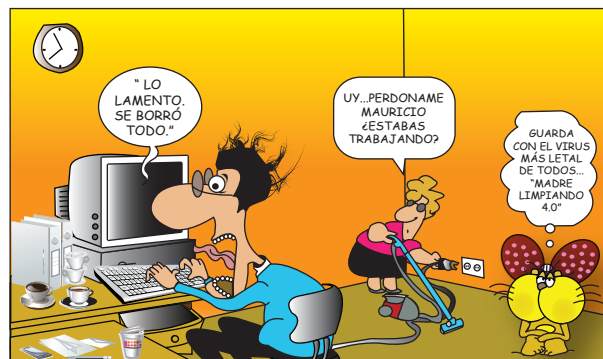
Figura 7. Una debilidad del respaldo de información