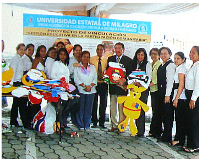
Foto 1. Autoridades de la UNEMI en clausura del proyecto de vinculación “Gestión Educativa en la Participación Comunitaria” (Diciembre, 2010).