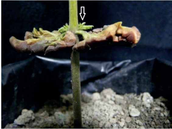
Figura 6. Engrosamiento de las yemas del nudo cotiledonar causada por F. decemcellulare .

hipertrofias que se ubican principalmente en el nudo cotiledonar. En la fase de vivero se puede observar cómo el ataque produce un engrosamiento en las yemas axilares. A diferencia de M. pernicioso , cuyo síntoma se observa en el ápice, este patógeno muestra los síntomas en las yemas axilares (Fig.6). Agente causal. F. decemcellulare es el hongo que produce las agallas o bubas en plantas adultas de cacao (Sosa et al. 2016).