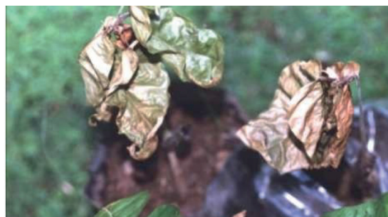
Figura 1. Tizón en las hojas, marchitamiento y muerte de plantas causado por P. palmivora . [Foto Dercy Parra (DP)/ Carmen Camejo (CC)].

Síntomas en vivero. Ocasiona manchas acuosas pardas e irregulares que se presentan en cualquier parte del limbo foliar (Fig.1). En fases avanzadas de vivero provoca una muerte regresiva de las plántulas en viveros (Phillips-Mora y Cerda 2009). Comienza con el oscurecimiento del tejido seguido de una necrosis, síntomas similares tanto en los chupones como en las plántulas (Surujdeo-Maharaj et al. 2016). En general, las hojas jóvenes son más susceptibles que el tejido maduro (Surujdeo-Maharaj et al. , 2016). P. palmivora puede provocar marchitamiento y muerte de las hojas en plantas adultas (Hardy 1961).