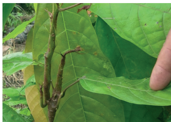
Figura 5. Hipertrofia de los tejidos del cogollo en una plántula de cacao afectada por M. perniciosa en vivero.

Síntomas en viveros. Este hongo produce enplántulas de vivero atrofia sobre crecimiento, que se manifiesta con un engrosamiento de la yema terminal (Fig. 5) o de las laterales (Maddison y Mogrovejo 1985). En la primera etapa de la infección el hongo establece una relación biotrófica con el hospedante, siendo esta etapa donde causa la hipertrofia, la pérdida de la dominancia apical y la proliferación de las yemas axilares de los tejidos jóvenes de cacao (End et al. 2014). La hipertrofia de los meristemos infecta dos siempre causan muerte total de los tejidos afectados. Hasta un 21% de un total de 600 plántulas de vivero de 5-7 meses de edad manifestaron síntomas de escoba de bruja a los dos meses de su trasplante a campo, lo que sugiere que fueron infectadas en el vivero (Maddison y Mogrovejo 1985). Se ha demostrado que este hongo se transmite por semilla (Cronshaw y Evans 1978; End et al. 2014). Para la obtención de semillas para la siembra del patrón se recomienda descartar los frutos de plantas afectadas por esta enfermedad.