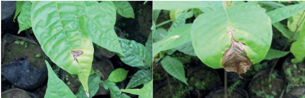
Figura 2. Síntomas iniciales a la izquierda y avanzados de la antracnosis en hojas, nótese la combinación de clorosis y necrosis.

Cuando estas manchas son abundantes, se unen hasta formar parches pardos oscuros que pueden secar la hoja completamente (Fig.2). El síntoma típico son manchas pardas en forma de cuña que avanzan desde el ápice de la hoja hacia el centro de la hoja por la nervadura principal y se conoce como antracnosis. Un aspecto a destacar es el hecho de que las defoliaciones repetidas pueden a veces causar la muerte del brote, dando lugar al desarrollo de ramillas laterales que en ocasiones dan la apariencia de una escoba de bruja (Hardy 1961; Akrofi et al. 2016).