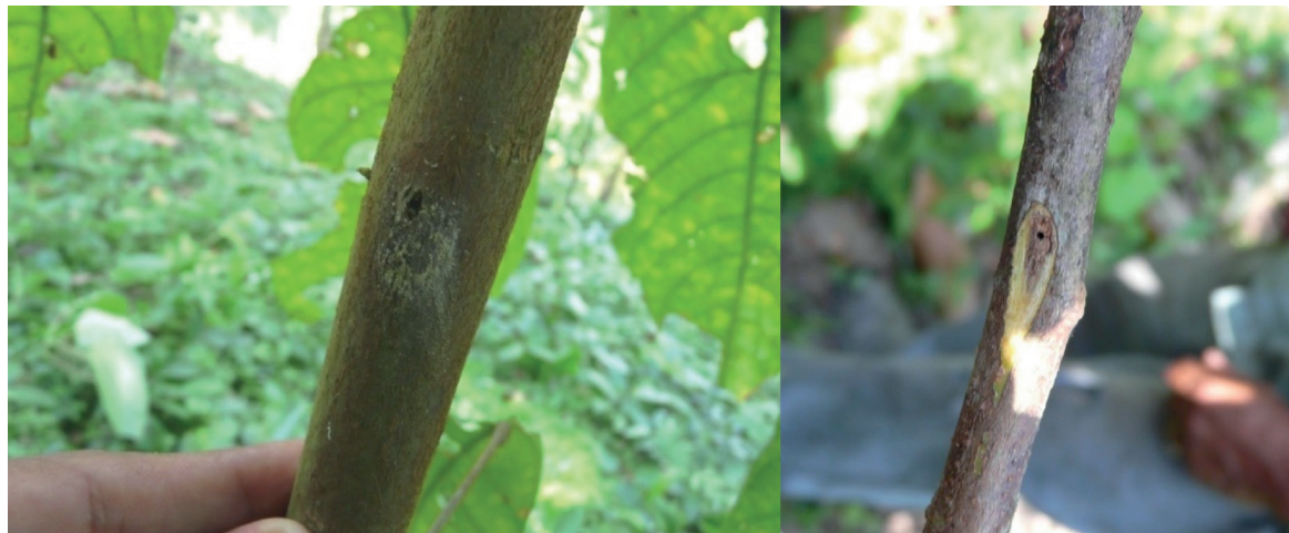
Figura 8. Tallo de una plántula de vivero perforado por la alimentación de Xyleborus spp. mostrando aserrín (izquierda). Plantada más de cuatro meses con perforación, y necrosis causada secundariamente por L. heobromae (derecha).

El papel de los insectos benéficos es poco importante en vivero, que es la única fase en la que se justifica el control de insectos destructivos (Enríquez 1985). El reducido tamaño de los viveros disminuye el peligro de la utilización de insecticidas con prolongada residualidad para el combate de insectos-plaga, ya que a su vez estos insecticidas también destruyen a los insectos benéficos (polinizadores, parásitos y predadores) (Páliz et al. 1982; Valerazo et al. 2013).