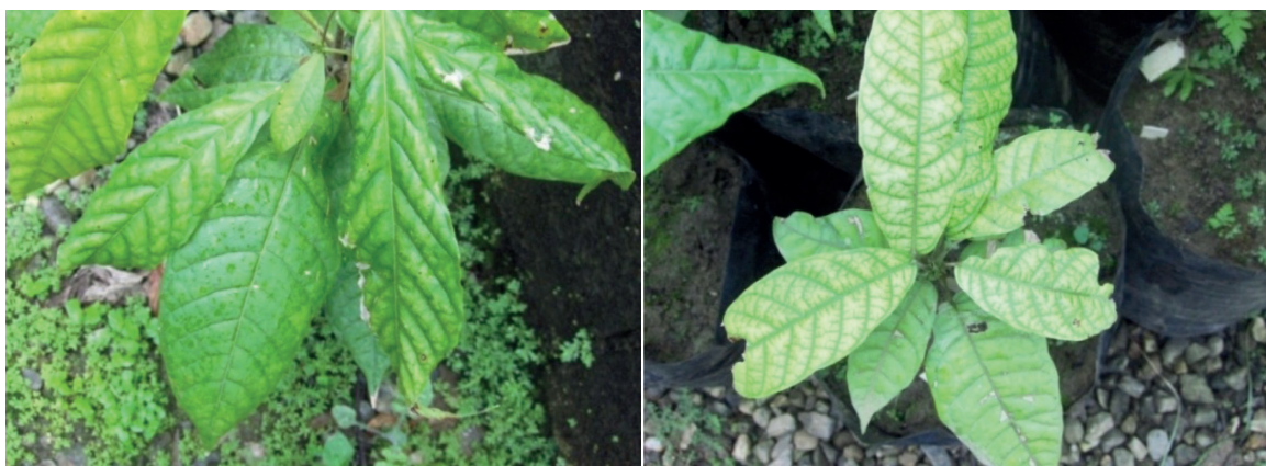
Figura 9. Mal formaciones en hojas por deficiencias nutricionales (izquierda) y clorosis por deficiencia de nitrógeno (derecha). [Fotos DP/ CC].

1985; Hardy, 1961) y pueden resumirse como clorosis en las plantas completas, clorosis moteada de los espacios internervales de las hojas, deformación de la lámina foliar, necrosis foliar, disminución del tamaño de la hoja, ya cortamiento de los entre nudos, entre otros (ver algunos síntomas en la Fig. 9).