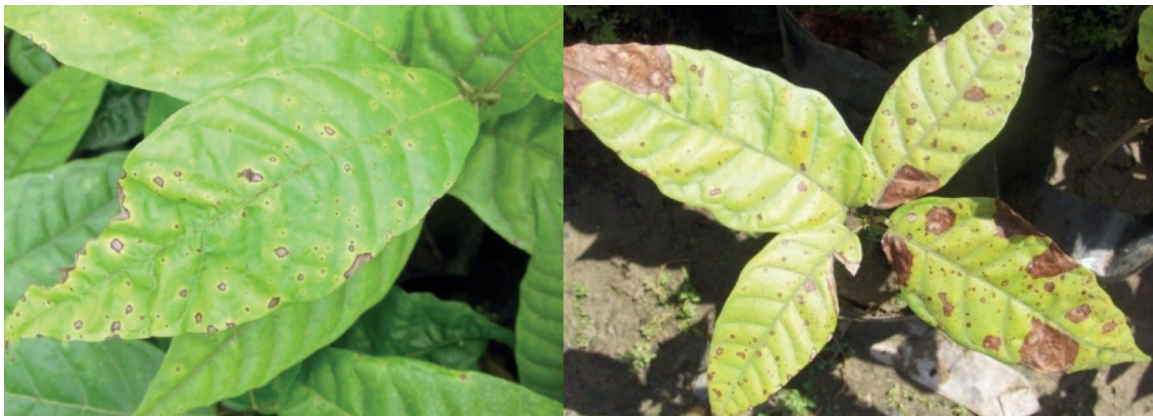
Figura 3. Síntomas iniciales y avanzados causados por C. cassiicola .

En plantaciones adultas se considera su daño como insignificante, tanto en hojas (Urdaneta y Delgado 2007) como en frutos (Falconi et al. 2007).