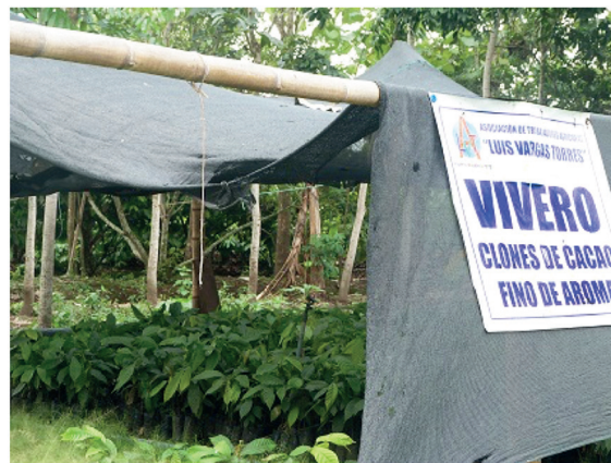
Figura 10. Vivero que oferta clones de cacao fino de aroma. Iniciativa auspiciada por una organización de productores. [Foto SPM].

confirma que esos clones son los menos sembrados y solicitados a los viveristas.