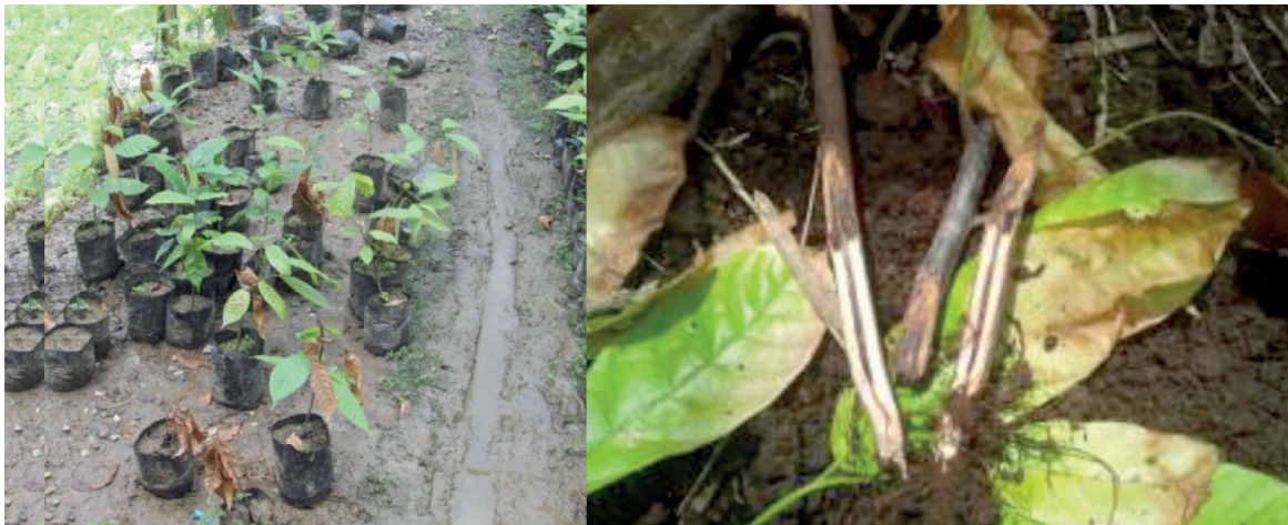
Figura 12. Fundas ubicadas en zona de drenaje deficiente (izquierda) y plántulas mostrando necrosis en la zona del injerto (derecha). El exceso de humedad y la materia orgánica inmadura afectan a la sobrevivencia post-injerto de las plántulas.