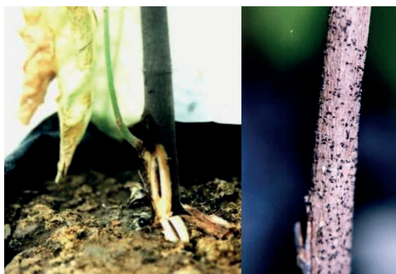
Figura 4. Injerto de cacao infectado por L. theobromae mostrando necrosis en la unión injerto/patrón y picnidios del hongo sobre el tallo del patrón de cacao.

Pudrición seca de los haces vasculares, deshilachado de la corteza del tallo, marchitamiento del injerto, hojas con coloración amarilla intensa y crujiente al tacto (Hardy, 1961). Internamente, los tejidos afectados presentan coloraciones de gris oscuro a pardo rojizo. Aparecen áreas necrosadas en los talluelos, los cuales evolucionan hacia muertes regresivas (Reyes y Capriles 2000). En fases avanzadas se aprecian numerosos picnidios del hongo de color gris oscuro ubicados en el portainjerto o el patrón (Fig.4).