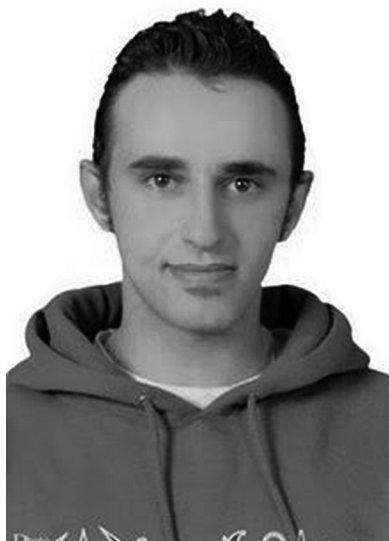
Foto 1. Primera imagen de Khaled Said, 19 de julio de 2010