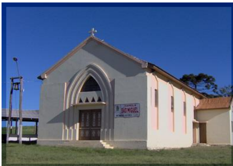
Imagem 4 – Capela de São Miguel, localizada no distrito do Pulador (2017)