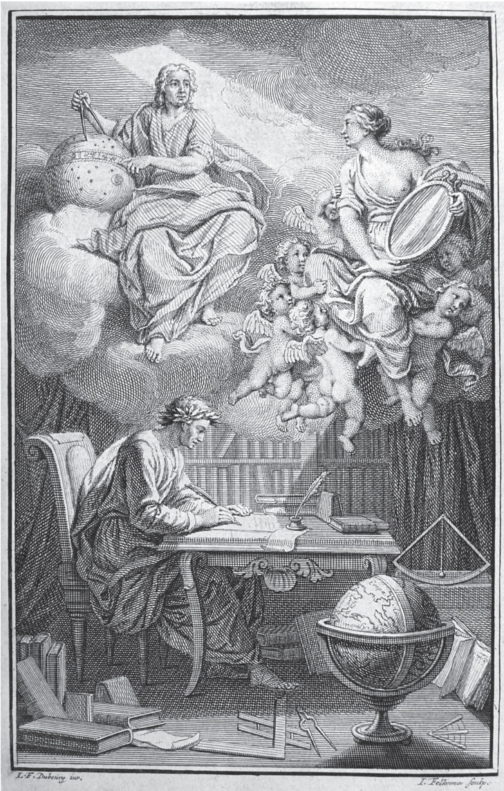
FIGURA 4 Voltaire, Elementos de la filosofía de Newton (1738)