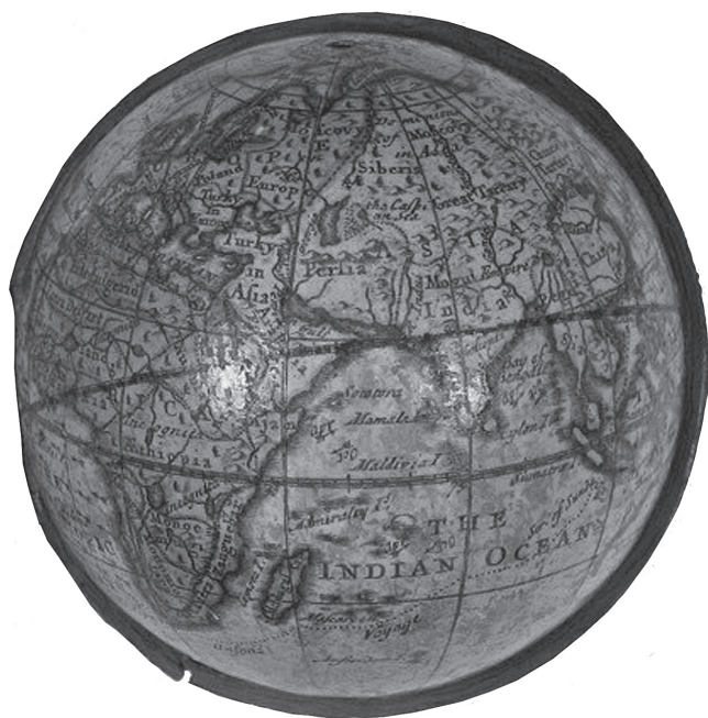
FIGURA I Globo terráqueo de bolsillo (1730)

un mayor número de personas tuvo la capacidad de orientarse con respecto a un “todo” que ninguno de ellos podía ver. Las figuras 1 y 2 presentan dos ejemplos del siglo XVIII de este tejido cultural: un globo terráqueo de bolsillo junto con su estuche que, a su vez, tiene grabado un globo celeste. Este juego de bolsillo recrea el espacio de la Europa de la modernidad temprana como dos esferas posicionadas de manera concéntrica que, a su vez, enmarcan el dominio en el que la vida terrestre podía imaginarse. Aunque no hay ninguna evidencia de que el astrónomo Tench poseyera un globo de bolsillo, con seguridad dominaba el aparato intelectual sobre el que los globos estaban fundamentados. Con este aparato conceptual a su disposición, supo en dónde estaba situado incluso cuando el “dónde” le era desconocido.