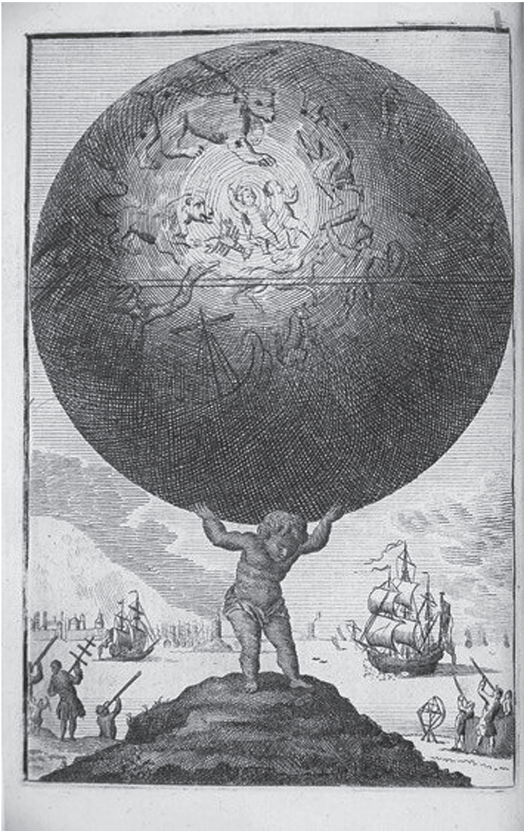
FIGURA 5 Nuevo Atlas de Niños (1776)