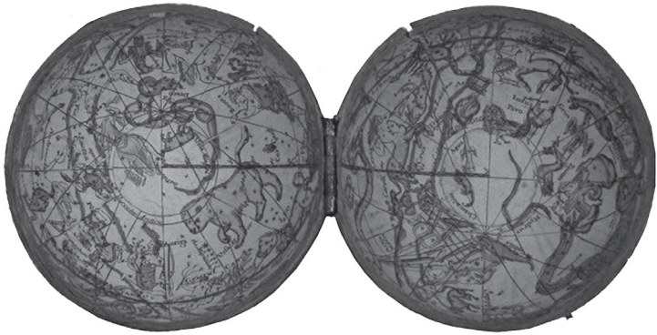
FIGURA 2 Globo celestial de bolsillo (1730)

Al combinar el informe de Tench con el contexto espacial asumido por los globos, vemos la segunda manera en que el pensamiento espacial redujo la distancia entre los exploradores y sus compatriotas: la difusión de libros y otros elementos de cultura material. Entre los ejemplos más importantes de libros están los informes de viajes de la modernidad temprana que ubicaban al lector en el espacio gracias a descripciones del terreno observado. 11 Con respecto a la cultura material, muchos textos sobre el espacio asumieron que el lector tendría un atlas o un globo a la mano. Un buen ejemplo es el Folleto de un viaje a Arabia y otros países circundantes , publicado en 1774 por el explorador danés-alemán Carsten Niebuhr. 12 Esta obra, inherentemente an-