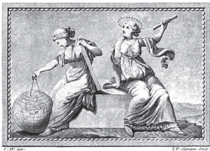
FIGURA 3 Niebuhr, Folleto de un viaje a Arabia (1772)

tropológica –y por desgracia olvidada– situó lo que hoy es el Medio Oriente dentro de un dominio “conocido”. Comienza con el viaje de Niebuhr en Dinamarca, sigue la trayectoria hasta Constantinopla e incluye las descripciones y mapas de otros lugares que el explorador visitó en el camino. El hecho de partir desde un dominio conocido produjo una certeza anclada en un espacio homogéneo que se hace evidente en el frontispicio del trabajo (Figura 3) y que representa una musa consultando un globo terráqueo mientras otra mira hacia los cielos. Las esferas concéntricas de los geógrafos, los geómetras, los astrónomos y los fabricantes de globos terráneos dotaron de sentido a los viajes de Niebuhr y construyeron el contexto de su pensamiento antropológico. Antes del auge de la era de las exploraciones, los europeos construyeron aquel espacio en el que la humanidad podía adquirir significado.