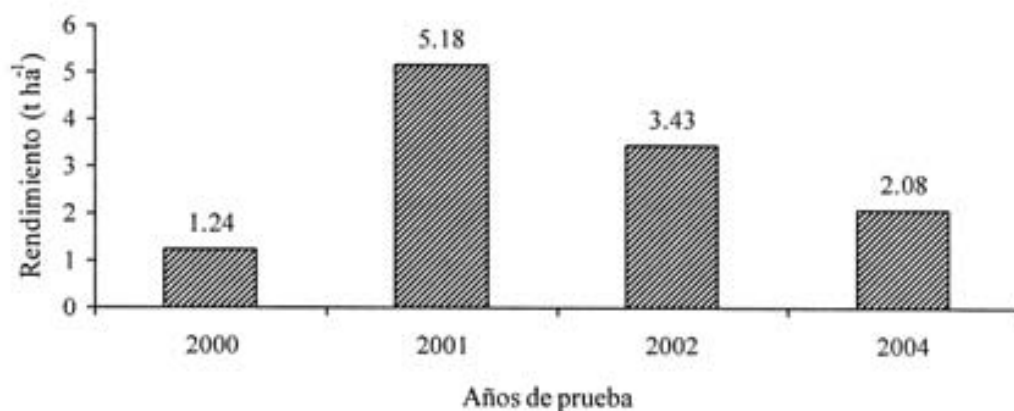
Figura 2. Rendimiento promedio obtenido con la variedad V-539 en cuatro años de evaluación de microorganismos de la rizósfera más fertilización química en un suelo Luvisol ródico en Uxmal, Yucatán, México.