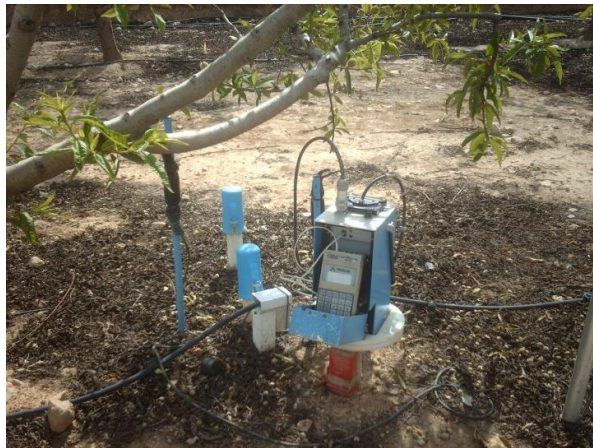
Figura 1. Sonda de neutrones utilizada para medir la humedad del punto en la rizosfera del melocotonero.