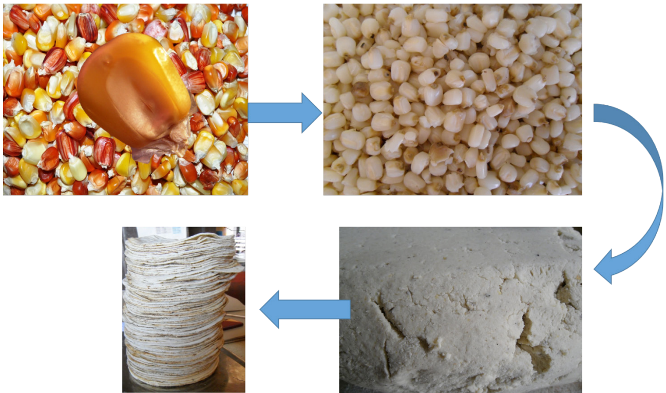
Figura 2. El proceso de 'nixtamalización' para remover el pericarpio del grano del maíz, para la obtención de masa y con ella elaborar las 'tortillas', el alimento base de los mexicanos, es una biotecnología prehispánica.

concentración de alrededor de 1 a 2 % para favorecer la remoción del pericarpio del grano de maíz. Posteriormente esta mezcla se decanta para eliminar tanto el pericarpio que se desprendió del grano como la cal utilizada, y luego lavar el grano cocido con suficiente agua. El grano cocido y sin pericarpio es entonces molido para la obtención de la masa que se usa en la elaboración de antiguos platillos como 'tamales', 'tortillas', 'tlacoyos', 'atoles', etc. (Trabulse, 1985; Vargas, 2014). Con la masa también se elaboran un buen número de bebidas tradicionales como el 'pozol' y el 'teshuino' que consumen las diferentes etnias de México (Cruz y Ulloa, 1973).