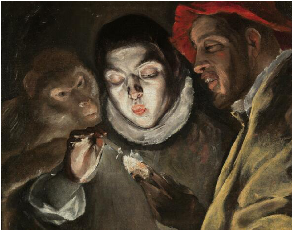
Figura 6. El uso del pigmento de la 'grana cochinilla' en el arte fue incorporado desde finales del siglo XVI. El Greco, famoso pintor español, lo utilizó en su cuadro Una Fábula (1580), Museo Nacional del Prado en Madrid España.

nitrocelulosa en la llamada técnica del "Western blot". El pigmento sigue teniendo gran demanda ya que se usa en la industria textil, en la industria alimentaria donde se le designa con la clave E120, en cosmetología, en el arte pictórico, etc.