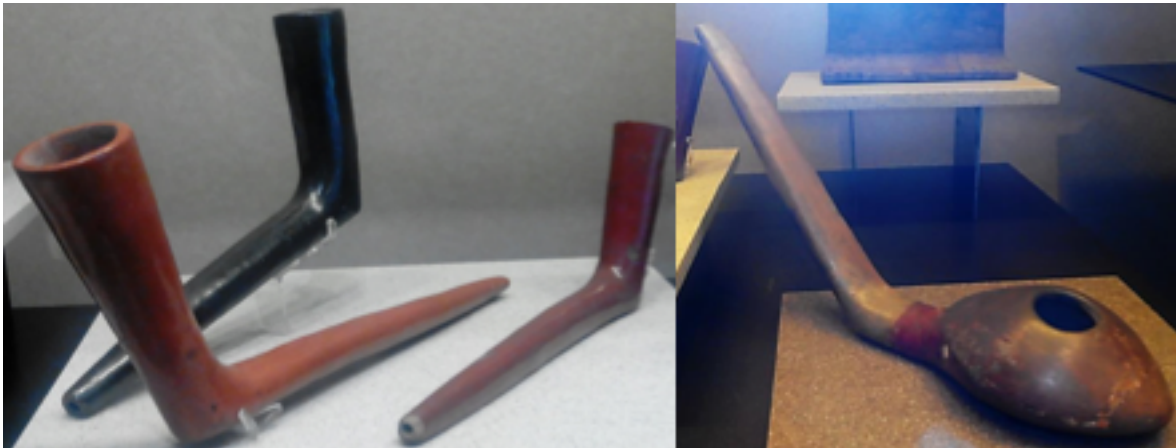
Figura 8. El dominio del curado y secado de las hojas del tabaco para ser fumado, estimuló la elaboración de pipas, Museo Nacional de Antropología e Historia, Ciudad de México.

que su nombre se derivó del estado de Tabasco en México, lugar donde se producía a gran escala.