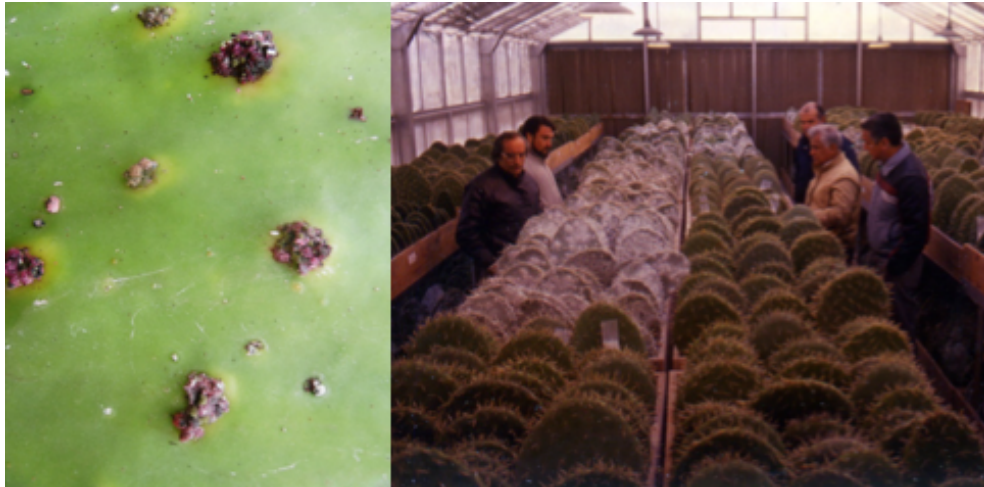
Figura 4. Cultivo de nopal ( Opuntia sp.) con el ácaro que lo parasita ( Dactylopius coccus ), que produce el pigmento que actualmente conocemos con el nombre 'grana cochinilla'.