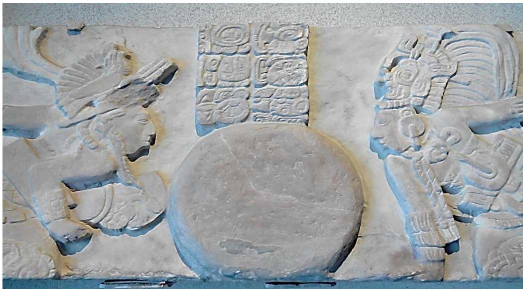
Figura 7. El juego de pelota en el Monumento de Poo (Toniná), Chiapas. Periodo clásico tardío (727 a. C.). El conocimiento del manejo de polímeros para la elaboración de la pelota fue una biotecnología importante en las culturas mesoamericanas, Museo Nacional de Antropología e Historia, Ciudad de México.

Una de las plantas de mayor interés que sorprendió a los conquistadores en su llegada a América y que poco se ha enfatizado en las publicaciones de los etnobotánicos mexicanos, fue sin lugar a dudas el fumar las hojas del tabaco ( Nicotiana tabacum ) (Figura 8). Según se menciona en los códices (Mohar, 2013a), esta planta se usaba para pagar tributo. El tabaco debe su nombre a la isla antillana de Tobago, lugar donde los compañeros de Cristóbal Colón, los marineros Rodrigo de Jerez y Luis de la Torre vieron por primera vez que se fumaba. Otra hipótesis reseña