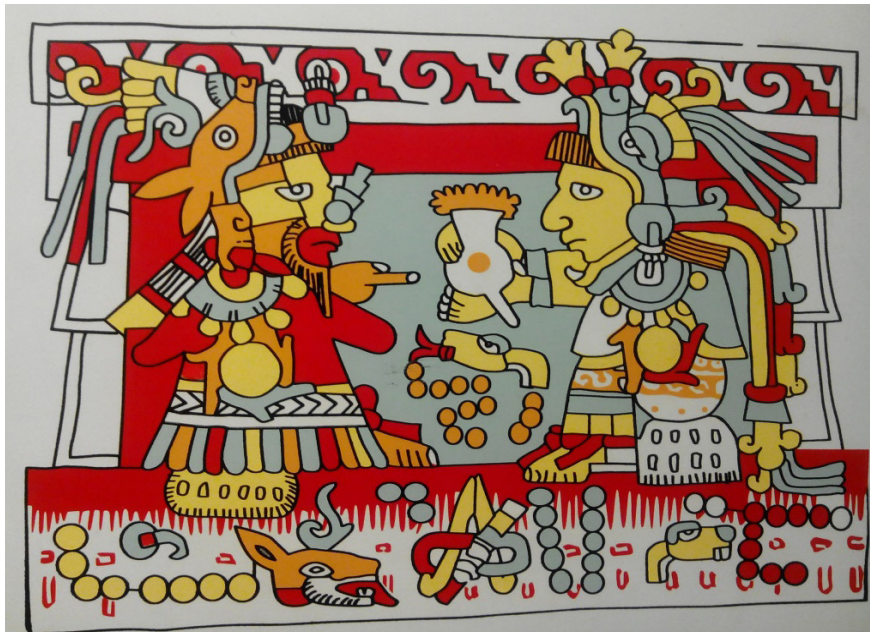
Figura 3. Fotografía del códice prehispánico mixteco "Zouche Nutlal", en el que se utilizaron biotecnología como la curtiduría ya que fue hecho sobre piel de venado y se usaron pigmentos vegetales. Se ilustra a un rey que recibe de su esposa un jarro con chocolate, alimento en el que la fermentación era fundamental. Museo Nacional de Antropología e Historia, ciudad de México.

sin haber sido previamente fermentadas, no desarrollan el sabor característico del chocolate.