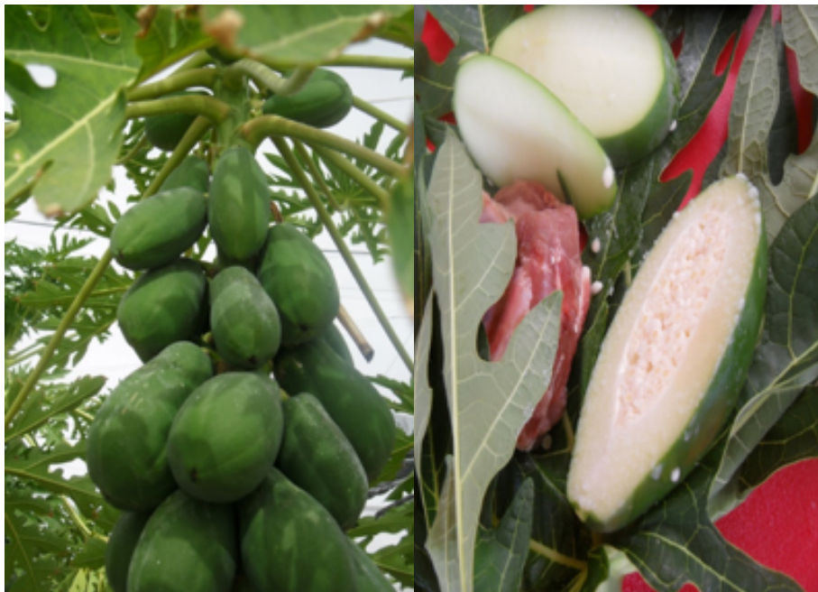
Figura 1. Indígenas mexicanos enredaban los trozos de carne en hojas de papaya ( Carica papaya ) y le adherían pedazos de los frutos de los que exudaba una sustancia blanquizca para ablandar la carne que conocemos como la enzima papaína.

Básicamente la nixtamalización (del náhuatl 'nixtli': cenizas de cal, y 'tamalli': masa de maíz) consiste en cocer maíz de 60 a 90 min con cal (hidróxido de calcio) a una