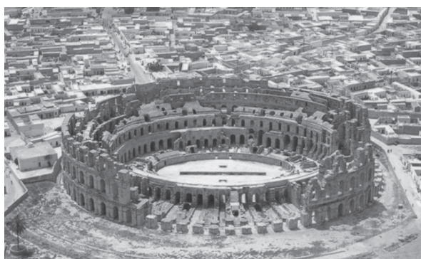
Imagen 1. Circo Romano

De acuerdo con Foucault (1975) esa moderna forma de poder es bien diferente de la forma clásica de poder incorporado en el “espectáculo”. Tanto en el espectáculo público del castigo como, desde luego, en el teatro, la mayoría observa a algunos pocos y esta observación está destinada al control de las masas.