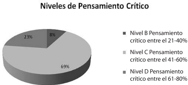
Figura 2. Niveles de pensamiento cr tico en relaci n con las habilidades evaluadas.

La figura 2, permite observar c mo se encuentran los estudiantes caracterizados de acuerdo con las habilidades de inter s. El 69% de la poblaci n estudiada posee un pensamiento cr tico en el nivel C, es decir menor al 60%, lo que permite inferir el desarrollo de estrategias metodol gicas para potencializar estas habilidades.