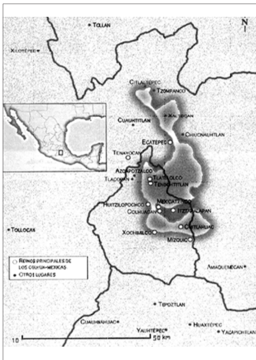
Fig. 1. Antiguos lagos de la cuenca del Valle de México.