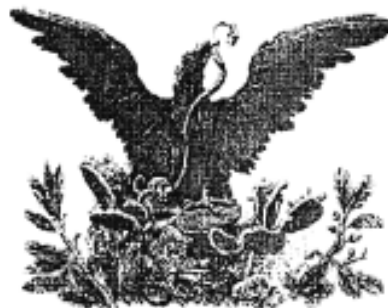
Fig. 11. Escudo de la República del año 1867.

Del año 1824 al año 1934 el águila se conservó de frente con las alas extendidas y la cabeza hacia la izquierda y parada en un nopal. Las ramas de laurel y encino variaron en tamaño pero no de posición (Figs. 11 y 12).