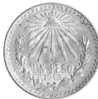
Fig. 20. Moneda del año 1943 con una rama de encino hacia el 19 y una de laurel hacia el 43.

En el caso del laurel, grabado a partir del escudo en el año 1950 cuyas hojas se muestran verticiladas, debería tenerlas tal como se venían representando