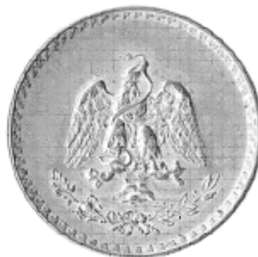
Fig. 12. Escudo del porfiriato de los años de 1876 a 1910.