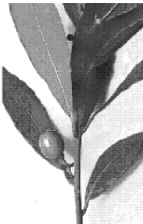
Fig. 19. Laurel Laurus nobilis . L.

En el caso del laurel, grabado a partir del escudo en el año 1950 cuyas hojas se muestran verticiladas, debería tenerlas tal como se venían representando