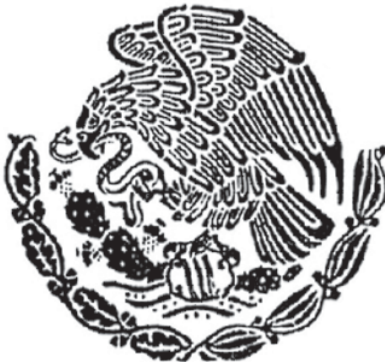
Fig. 14. Escudo de los años de 1950 a 1970.

En el año 1968 se promulgó la ley sobre las características del escudo nacional actual que muestra un águila mexicana de perfil derecho pero erguida. La pata izquierda posada en una de las pencas de un nopal que nace de una piedra con tres rayas y cuatro círculos, sujeta con la garra derecha y con el pico una serpiente de cascabel. De la roca sale el lago totalmente estilizado con tres círculos y tres caracoles.