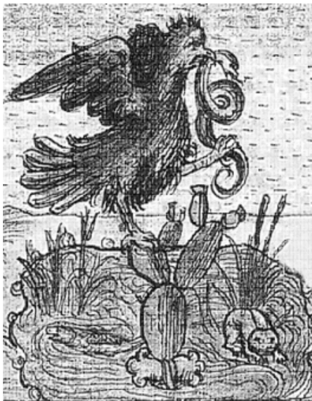
Fig. 5. Códice Durán.