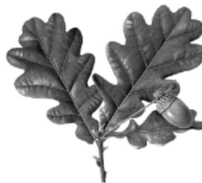
Fig. 17. Encino Quercus robur L.

El encino representa la fuerza, su presencia como es de influencia europea es fácil reconocer que se trata de la especie Quercus robur por el número de lóbulos de 4 a 6 y el pedúnculo largo del fruto (Fig. 17).