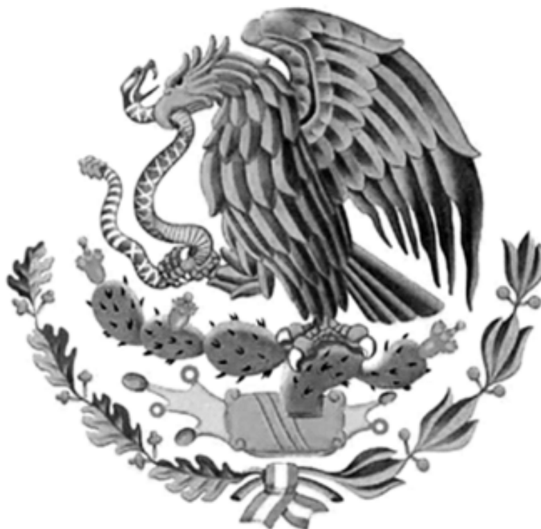
Fig. 15. Escudo actual a partir del año1970.