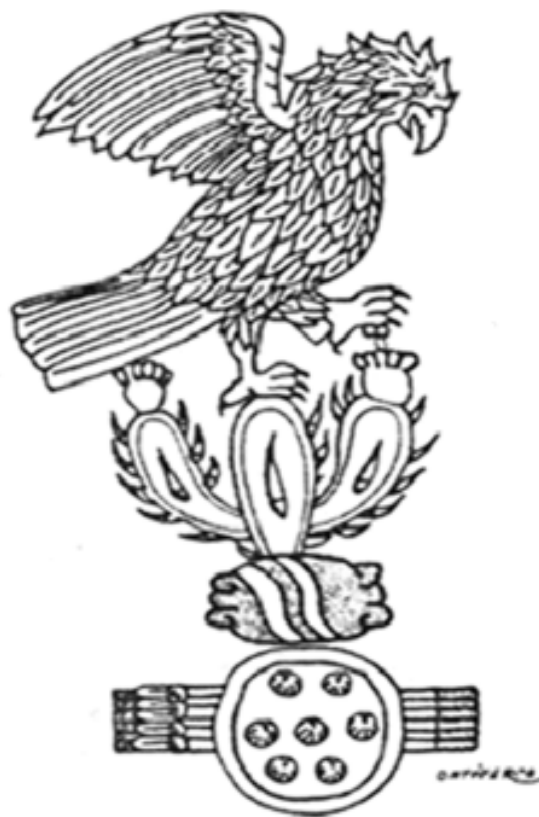
Fig. 4. Códice Mendoza.

religioso colonial o por concepto religioso prehispánico ya que antes de la fundación de la Gran Tenochtitlán existen indicios en culturas en donde ya se representaba un águila devorando a una serpiente. El águila está parada en un nopal con frutos. El nopal nace sobre una roca que está en medio de un lago. En el lago se observan tulares ( Typha L.) vegetación característica del lugar donde se establecieron los mexicas (Fig. 5).