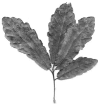
Fig. 18. Encino Quercus laeta Liebm.

el escudo de la Academia de San Carlos y en muchas de nuestras monedas (Figs. 19-20).