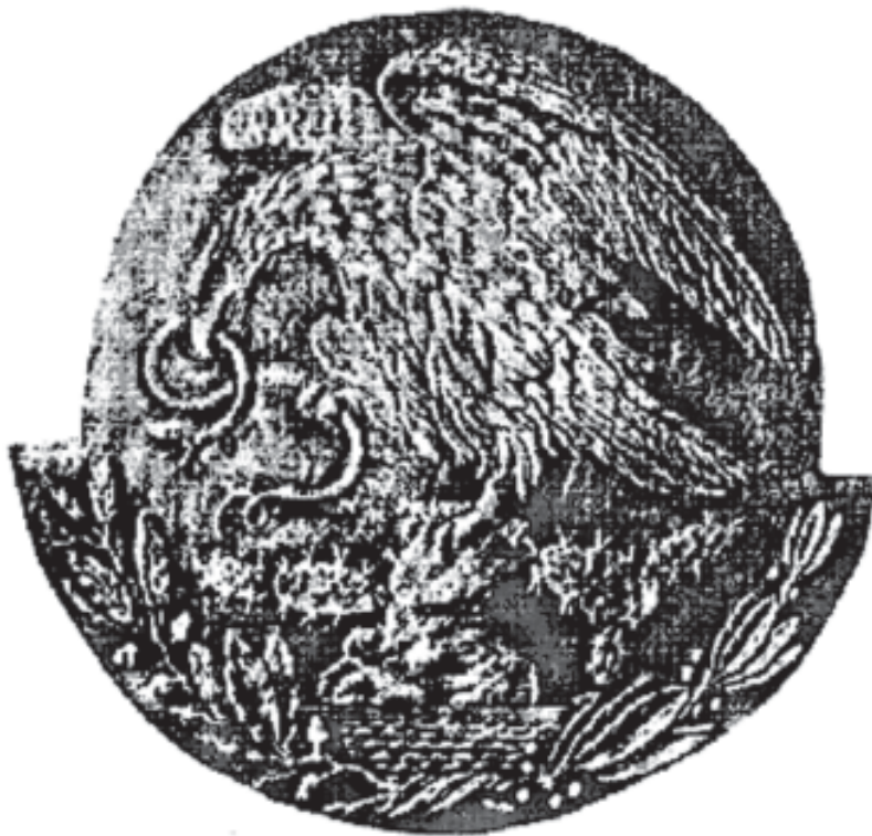
Fig. 16. Moneda en honor de Guadalupe Victoria conocida como "Peso de Victoria".

roca sale un nopal con cinco pencas espinosas, abajo, en semicírculo, hacia la derecha, una rama de encino y hacia la izquierda una rama con los frutos bien definidos de laurel, pero con las hojas verticiladas, formando paquetes en el mismo nivel. Tal vez se deba a que el grabador hizo una mala apreciación de la distribución de las hojas y el error del laurel se hizo presente en el "Peso de Victoria" (Fig. 16).