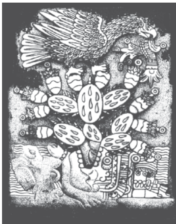
Fig. 2. Fundación de México-Tenochtitlan.

mexicas por su dios Huitzilopochtli en la cual menciona que deberían establecerse donde encontrarán un águila parada sobre un nopal. El nopal presenta frutos que conservan parte de sus estructuras florales y nace del corazón del cuerpo tendido en el agua de Copil, sobrino y enemigo del dios mexica que es vencido en una guerra y arrojado a un lago donde se convierte en piedra. La piedra es el islote perteneciente al lago de Texcoco donde levantarían su imponente y maravillosa ciudad que llegó a ser el dominio de la mayor parte del mundo prehispánico y el águila sobre el nopal, la identidad de México como nación (Fig. 2).