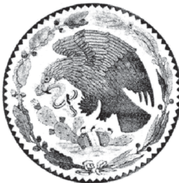
Fig. 13. Escudo del año 1934.

cambiaron de posición con respecto a los escudos anteriores: el laurel estaba hacia la izquierda y el encino hacia la derecha. Tanto las hojas como los frutos de ambas especies se ven claramente definidos (Fig. 13).