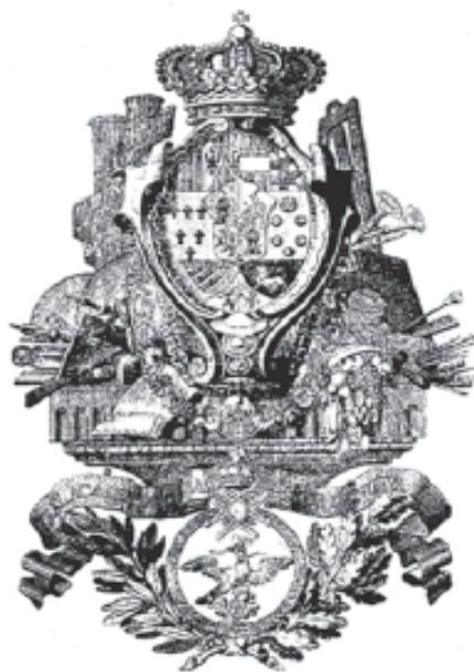
Fig. 6. Emblema de la fundación de la Academia de San Carlos.

La especie Laurus nobilis es una reliquia de la antigua flora subtropical del mediterráneo, propia de los encinares