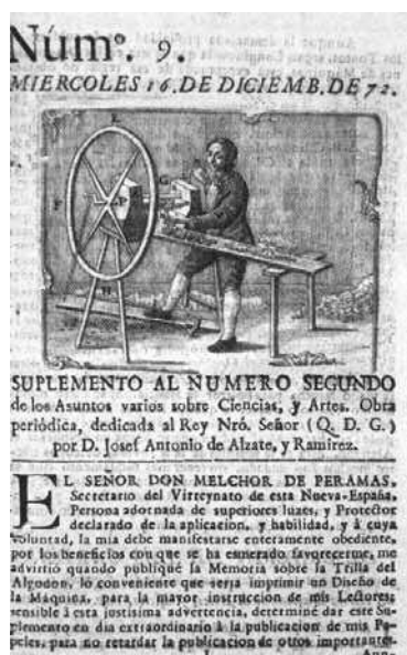
Figura 1. Portada Josef Antonio Alzate y Ramírez, Suplemento al número segundo de los asuntos varios sobre ciencias, y artes. Núm. 9, miércoles 16 de diciembre de 1772, México. navegación y de todo aquello que tiene relación con el bien público.

Especial atención se le daría a los temas locales como la agricultura, minería, geografía de América, historia natural y medicina. Finalmente, invitaba a sus lectores a que se le hicieran sugerencias y observaciones, y se le enviaran noticias para difundirlas.