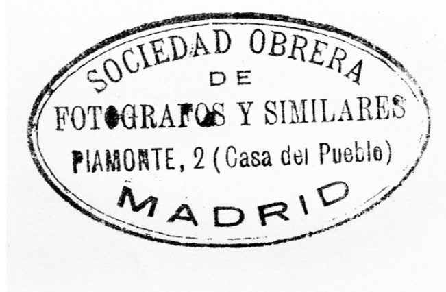
Figura 6. Sello de la Sociedad Obrera de Fotógrafos y Similares.