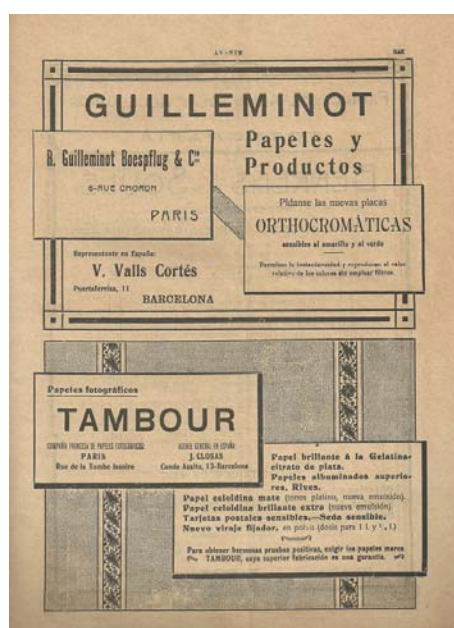
Figura 5. Publicidad en el número 2 de Avante .