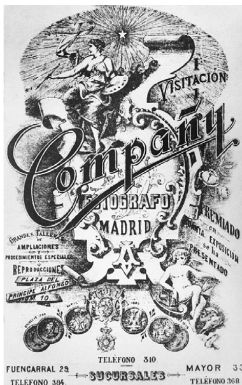
Figura 1. Compañy. Reverso de fotografía.

Fue fotógrafo de la Casa Real y en sus estudios se formaron Alfonso y Campúa, los dos grandes reporteros de comienzos de siglo. Popularizó las “ambulancias” o servicios de información gráfica urgente, y en 1893 realizó reportajes de la guerra del Rif como enviado especial de Blanco y Negro . En la necrológica de ABC se le atribuye la introducción del uso del magnesio, y sus méritos fueron reconocidos con medalla de oro en las Exposiciones Universales de París y Bruselas (1889, 1890), y diploma de honor en Bruselas (1891). Recibió dos condecoraciones: Caballero de la Orden Civil de Alfonso XII y Comendador de la Orden de Carlos III. Falleció en Madrid el 13 de enero de 1909 dejando un extraordinario fondo: “El archivo de la Casa Compañy es un recuerdo elocuente de toda una generación que va desapareciendo poco a poco, como ahora ha desaparecido de entre nosotros el hombre que lo fuera formando” ( Por Esos Mundos , 1 de febrero de 1909: 184-185).