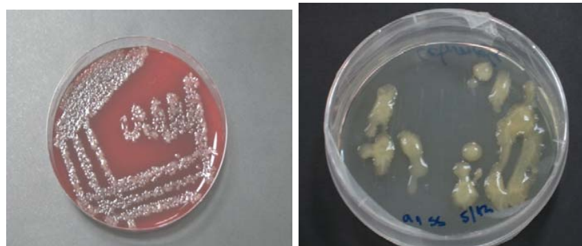
Figura 1: Desarrollo de colonias características de cepas bacterianas aisladas del estudio

La mayor sensibilidad (inhibición microbiana) de las cepas aisladas en este estudio se presentó frente a la asociación Sulfametoxazol/Trimetoprim con un 93,3% de inhibición. Gentamicina fue efectiva en un 86,6 % de los casos. En tercer lugar se ubicó la asociación Amoxicilina/ácido Clavulánico con un 80% de efectividad. Un efecto menor, 73,3% de sensibilidad mostraron las cepas aisladas y probadas frente a Enrofloxacino, situación que se repite en varios estudios relacionados con E. coli aisladas, eso sí desde infecciones urinarias (Cooke et al., 2002). Un 60% de los agentes bacterianos identificados en el presente trabajo fueron sensibles a Ampicilina y sólo un 40% de las cepas fueron sensibles a Cefadroxilo. E. coli manifestó escasa sensibilidad a este último antibiótico (sólo 25%).