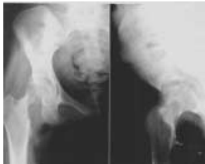
Figura 1 - Radiografia inicial do quadril demonstrando uma lesão lítica na região inferior do colo, e um achatamento na região ântero-superior da cabeça do fêmur.

O tratamento não cirúrgico foi iniciado com sulfametoxazol 2400mg associado com trimetoprim 480mg diariamente por 2 anos. Após 5 meses de tratamento houve melhora importante dos sintomas da paciente, e a radiografia da pelve demonstrava que a área lítica do colo do fêmur estava parcialmente preenchida por osso, restando apenas diminuição do espaço articular (Figura 2). Após dois anos, quando se deu o término do tratamento medicamentoso, a paciente estava assintomática, a radiografia da pelve demonstrava remodelação na região do colo do fêmur (Figura 3) e a ressonância magnética comparada com o exame inicial mostrou diminuição do edema ósseo, tanto no acetábulo como no colo e cabeça do fêmur, do derrame articular e da reação nos tecidos moles adjacentes (Figura 4). A contraímunoeletroforese específica para paracoccidiodomicose estava negativa.