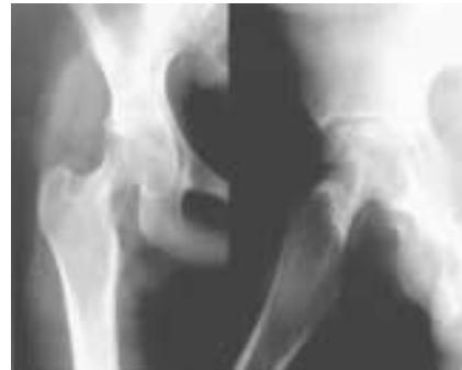
Figura 2 - Radiografia do quadril demonstrando recuperação parcial da lesão do colo femoral e diminuição do espaço articular, com 5 meses de tratamento.