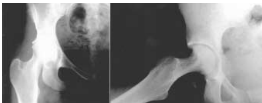
Figura 3 - Radiografias do quadril demonstrando remodelação do colo, retorno da esfericidade da cabeça do fêmur com diminuição do espaço articular após 2 anos de tratamento.