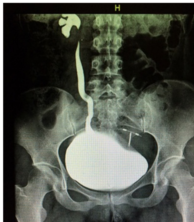
Figura 4 Cistograma de llenado con reflujo vesicoureteral derecho grado IV.

clara, sin embargo existe una relación de la patogénesis de uréter ectópico con o sin ureterocele, el desarrollo de los restos ureterotrigonales y renales. La mayoría de los ureteroceles y uréter ectópico son diagnosticados a través de ultrasonido prenatal. Los cuadros de presentación son muy variados, van desde infección de vías urinarias, incontinencia urinaria, tenesmo, pujo vesical, vaciamiento incompleto de orina, dolor suprapúbico, hasta el prolapso del ureterocele, similar a lo reportado en este caso. El diagnóstico por imagen se puede realizar con ultrasonido, tomografía axial multicorte y resonancia magnética nuclear 3-6 .