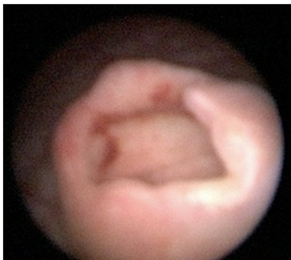
Figura 2 Destechamiento isquémico de ureteroceles simple intravesical derecho.

colocación de catéter doble-J ipsilateral, y un mes después se retiró dicho catéter. La paciente a los 3 meses se encontraba asintomática, y el cultivo y examen general de orina eran normales.