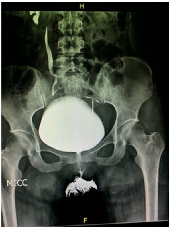
Figura 5 Radiografía contrastada miccional de cistograma, que muestra reflujo vesicoureteral derecho grado IV.

complicación reflujo vesicoureteral grado IV, el cual no afectó de forma permanente la función renal, ya que el tratamiento quirúrgico (reimplante ureteral derecho) se realizó adecuadamente.