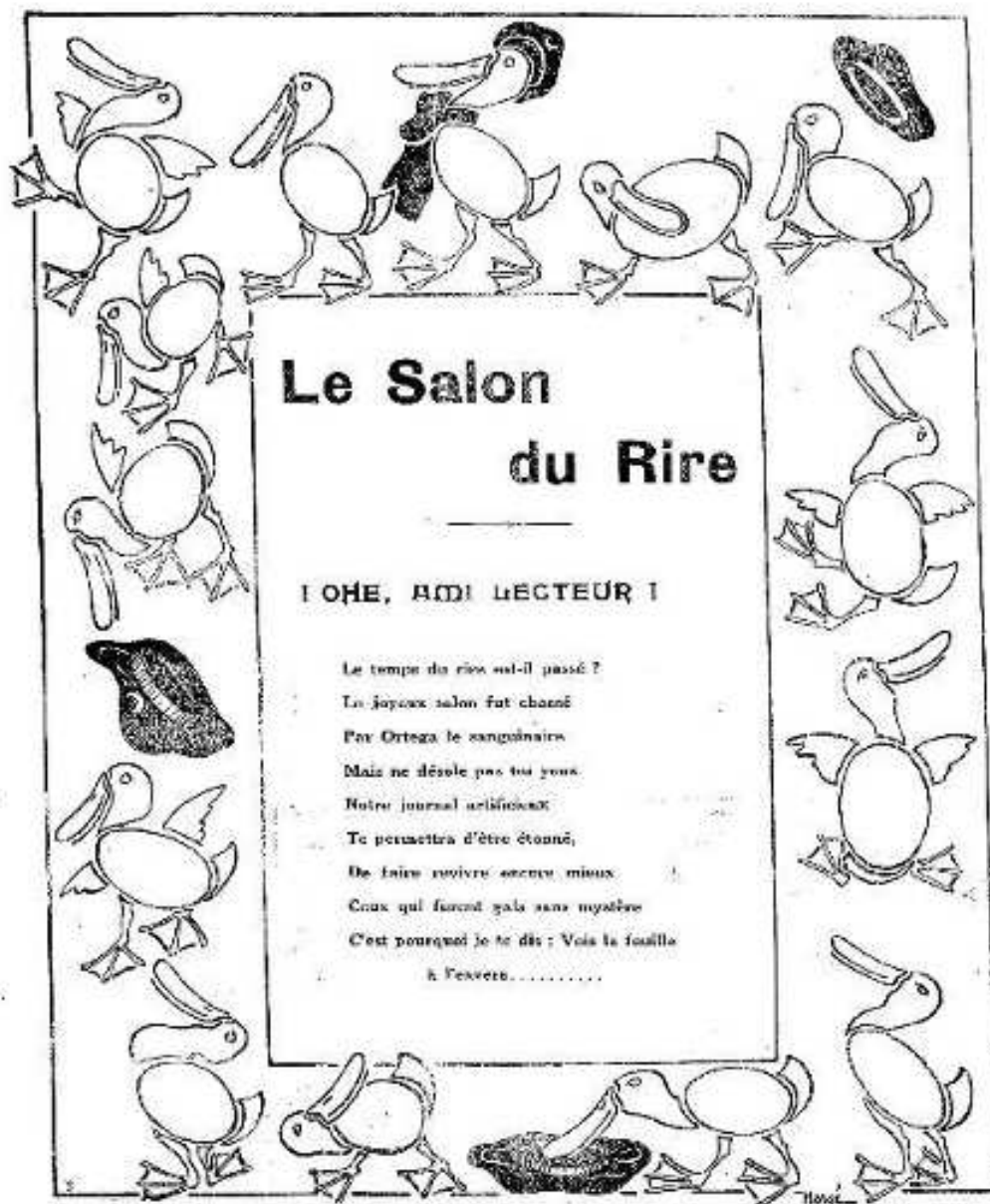
Figure 2 : Illustration tirée du journal Alger-Étudiant , no. 27, 5 Avril 1924, p. 5.