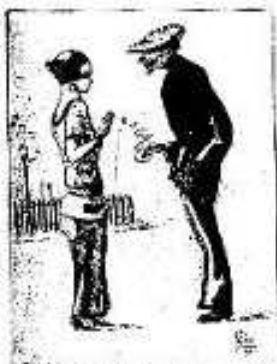
Table 1. Continued