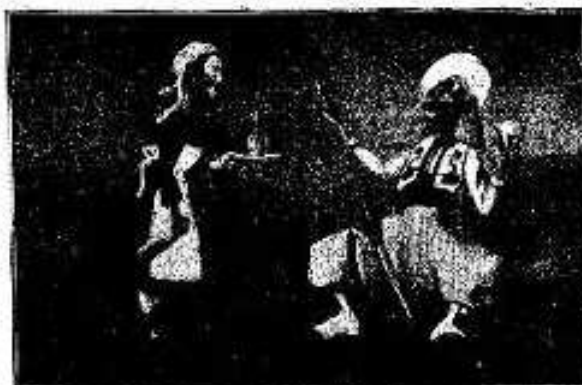
Examen de admisión