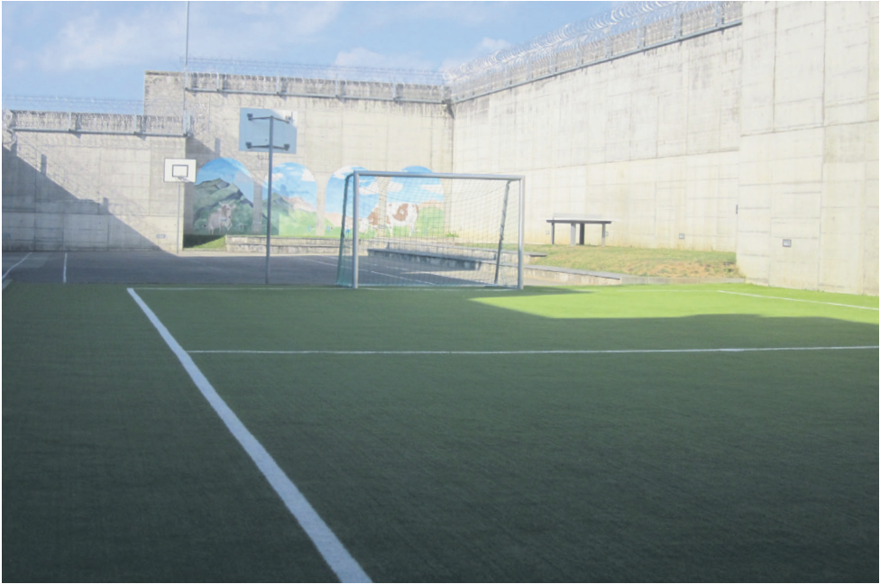
14 Terrain de sport extérieur. Place assise oui, mais aucune place avec ombre. Dommage.