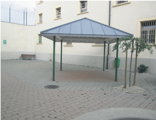
15 Bancs et abri dans la cour: abris, dessous les quels on pourrait installer quelques bancs supplémentaires.