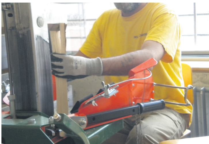
4 Je coupe encore et encore du bois.