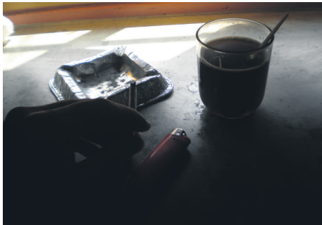
7 Après mon déjeuner je fais une pause.