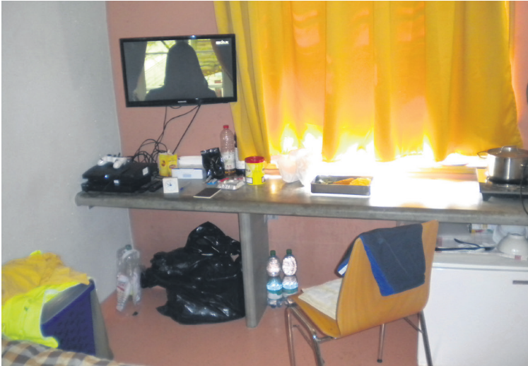
10 Mon côté salon et cuisine.