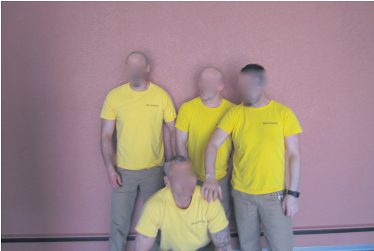
6 Moi avec mes collègues de travail avec qui je passe beaucoup de temps. (traduit du roumain)