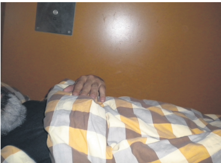
8 Aujourd'hui c'est férié, je me lève un peu tard.