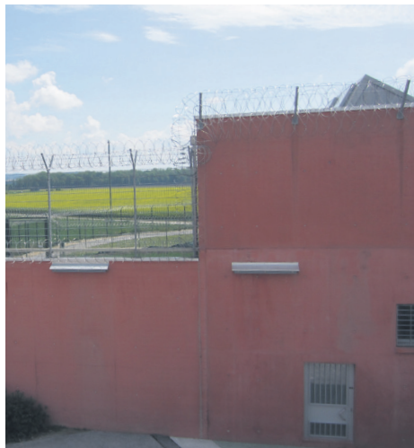
13 Le champ en face de ma chambre. J'aime le regarder. Il m'apaise. (traduit du roumain)