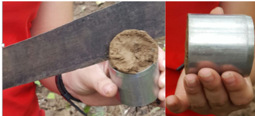
Figura 4. Preparación de las muestras de suelo.

Las muestras fueron llevadas al Laboratorio de Suelos de la Escuela de Ingeniería Forestal del Instituto Tecnológico de Costa Rica (TEC) donde fueron secadas a una temperatura de 105 °C por al menos 48 horas hasta llegar a un peso constante. Como último paso se determinó, por medio de una balanza electrónica, marca OHAUS, modelo PR de precisión, el peso seco de cada muestra de suelo. Para calcular la densidad aparente (DA) de cada una de ellas se empleó la Ecuación 1 .