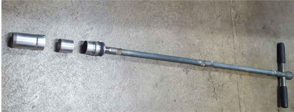
Figura 3. Barreno utilizado durante la recolección de las muestras de suelo.