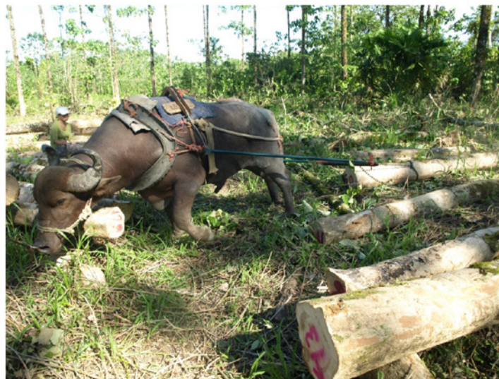
Figura 1. Método de arrastre de madera con cadenas, se emplea fuerza animal.

La descripción del suelo se realizó utilizando el Atlas digital de Costa Rica (2014), el cual arrojó la siguiente caracterización: orden Inceptisol, suborden Tropept, con horizonte B, cámbico.