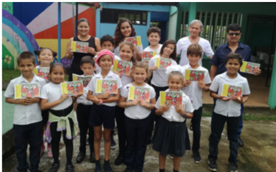
Figura 4. Estudiantes de cuarto año en la Escuela de Pochotal, Playa Hermosa.