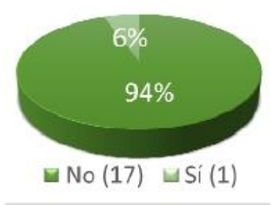
Figura 3. Plan de sucesión por escrito

Las empresas familiares arrojan resultados negativos en cuanto a su próxima sucesión, y no cuentan con un plan de sucesión por escrito, en su mayoría hay un 94% que no lo ha planeado, y solo un 6% si tiene un plan de sucesión para la siguiente generación, según se muestra en la figura 3.