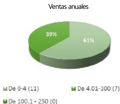
Figura 2 Clasificación de empresas

En cuanto al tamaño de la empresa, predomina la microempresa con ventas anuales de 0 a 4 millones de pesos, donde las decisiones son tomadas por el fundador, quien es predominantemente masculino (77.8%), con escolaridad de licenciatura (38.9%). El 100% de los integrantes de esta muestra son familiares. Figura 2.