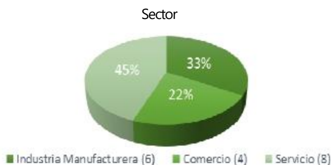
Figura 1 Sector

Entre los principales resultados, las EF de esta muestra pertenecen el 44.4% al sector servicios, el 33.3% a manufactura y el 22.2% al comercio. En esta muestra el que dirige la administración, es la generación fundadora con 61.1%. Figura 1.