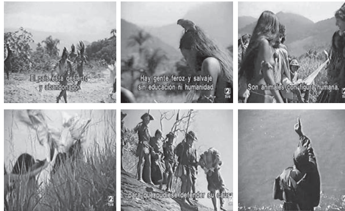
Figuras 23 a 28 – A carta narrada acima, em off , é acompanhada de imagens que a desmentem. Na figura abaixo, à esquerda, as índias despem-se dos trajes, numa imagem que lembra os movimentos feministas de 1968; nas figuras abaixo, ao centro e à direita, Jean, o protagonista do filme, é jogado do alto do penhasco, após receber a extrema unção, desmentindo a narrativa oficial que reportava seu suicídio. Jean, contudo, não se afoga, e ao encontrar terra firme, é aprisionado pelos tupiniquins e, posteriormente, pelos tupinambás.