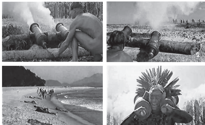
Figuras 35 a 38 – No alto, à esquerda, Jean, já incorporado à tribo, ensina aos tupinambás como utilizar a pólvora, que é usada na guerra contra os tupiniquins (alto à direita e abaixo, à esquerda) e, após o sacrifício de Jean, em festa ritual, Cunhambebe, munido de canhões, comemora a vitória sobre seus inimigos.