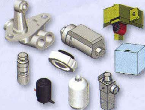
Componentes Banco de pruebas para boquillas de inyección de Combustible aeronáutico

Finalmente, se elaboró el plano en detalle de cada componente con el fin de identificarlo y dejarlo instaurado, para que el operador en el momento de realizar el mantenimiento, ya sea preventivo o correctivo, tenga información más exacta y así pueda llegar a estipular causas o posibles deterioros de componentes u otras posibles fallas que se presenten.