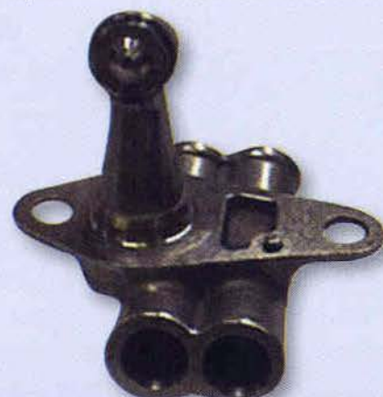
Inyector de PT6