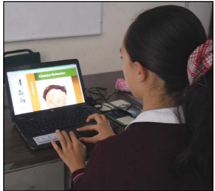
Figura 3. Lectura en pantalla de la versión digital del Texto Gratuito de Ciencias Naturales Sexto grado (SEP, 2009) por una alumna de educación primaria.

Sin embargo, se ha argumentado que algunos videojuegos y el uso de las TIC pudieran influir