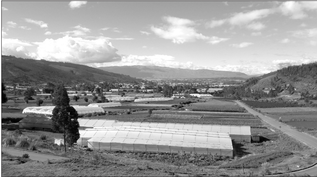
Imagen 1. Entre invernaderos y huertos: visión del paisaje agrario en San Luis en 2016