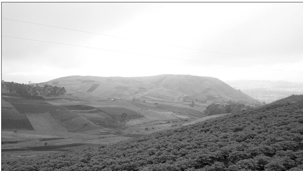
Imagen 2. Importancia de la papa: visión del paisaje agrario en la parte oriental del cantón Salcedo en 2015