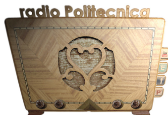
Ilustración 1. Portada de radio Politécnica