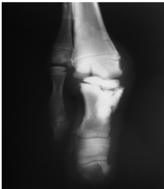
Figura 3. Radiografía dorsomedial-palmarolateral oblicua del nudo y falanges del miembro anterior izquierdo.

el nivel de la articulación interfalángica proximal del dígito III. En el miembro anterior izquierdo (Figura 3) el dígito supernumerario presentaba ambos huesos sesamoides proximales, y la longitud de este dígito alcanzaba hasta el nivel de la articulación interfalángica distal del dígito III.