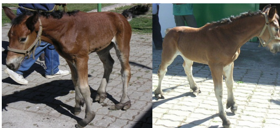
Figura 1. Vista lateral izquierda y derecha de la potranca con polidactilia en sus cuatro miembros.

La anamnesis reveló que pese a las malformaciones, la potranca pudo ponerse de pie, caminar y alimentarse por si sola