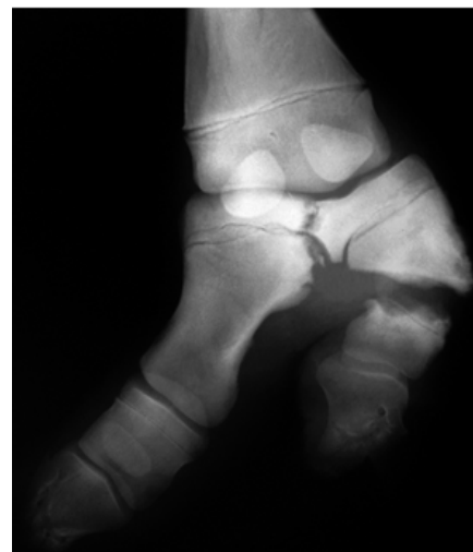
Figura 5. Radiografía dorsoplantar de las falanges del miembro posterior izquierdo.

marcada hacia plantar a nivel de articulación interfalángica proximal, por luxación completa de esta articulación en ambos dedos (hiperextensión). En el miembro posterior izquierdo (Figura 5) en la vista dorso plantar se observó pérdida del eje