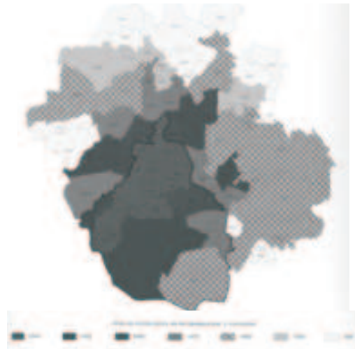
Mapa 2. Evolución del área metropolitana de la Ciudad de México, 1940-1995.

perdiéndole el paso a una urbe que no paraba de crecer. Los museos van quedando geográficamente rezagados frente al vertiginoso crecimiento urbano. Dado que éste no fue producto de una cuidadosa planificación, no se acompañó por una expansión descentralizada de los servicios básicos y de la oferta cultural, de manera que el acceso a los mismos se ha dificultado para la mayoría de la población que reside lejos del centro. Pero entre los museos y sus públicos potenciales se tienden no sólo kilómetros de distancia, sino también otras barreras que ha traído consigo el caótico desarrollo urbano, como el congestionamiento vehicular, la violencia y el comercio informal en las calles, los que, junto con el mayor peso de medios como la televisión y la radio en el tiempo libre de los habitantes, favorecen la desarticulación de muchos espacios tradicionales de encuentro colectivo y alimentan una creciente segregación social y espacial.