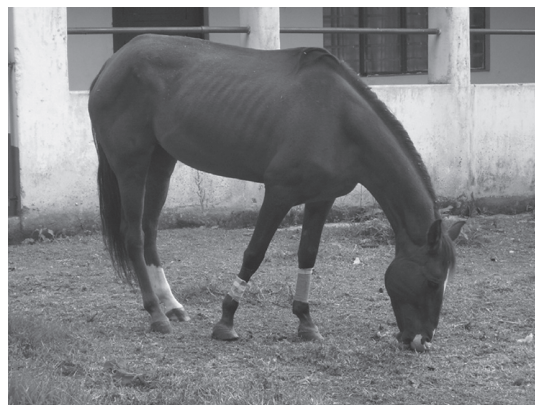
Figura 6. Se observa el paciente asumiendo una posición normal en la estación, poco tiempo después de la cirugía.