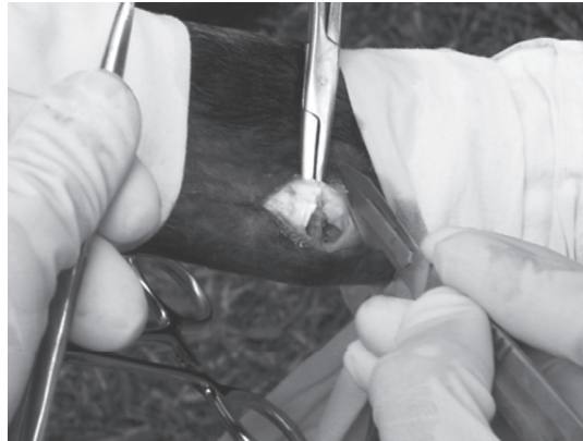
Figura 4. Tenotomía del tendón del músculo flexor profundo a nivel del terciomedio de la caña bajo anestesia general.