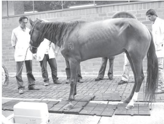
Figura1. Dolor severo a la estación, el paciente trata de apoyar más peso en los miembros posteriores, los cuales están adelantados bajo el abdomen.