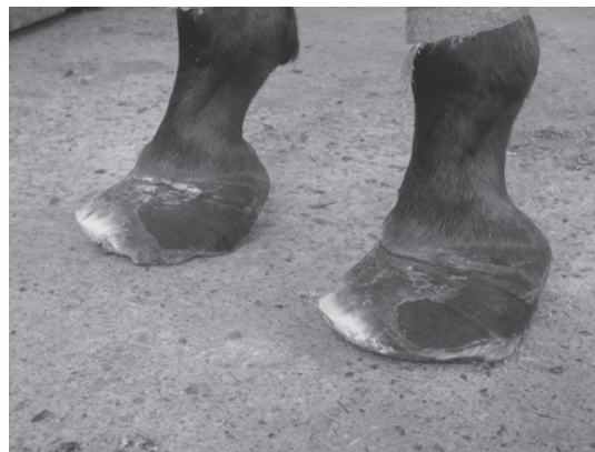
Figura 5. Aspecto que ofrecen los cascos luego de recortar el tejido corneo sobrante.