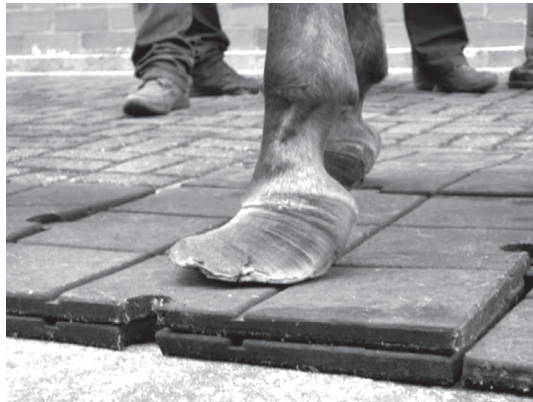
Figura 2. Casco deformado, en forma de babucha árabe, con la pinza larga y separada del suelo. Se observan, además, seños transversales en la pared y talones muy largos.